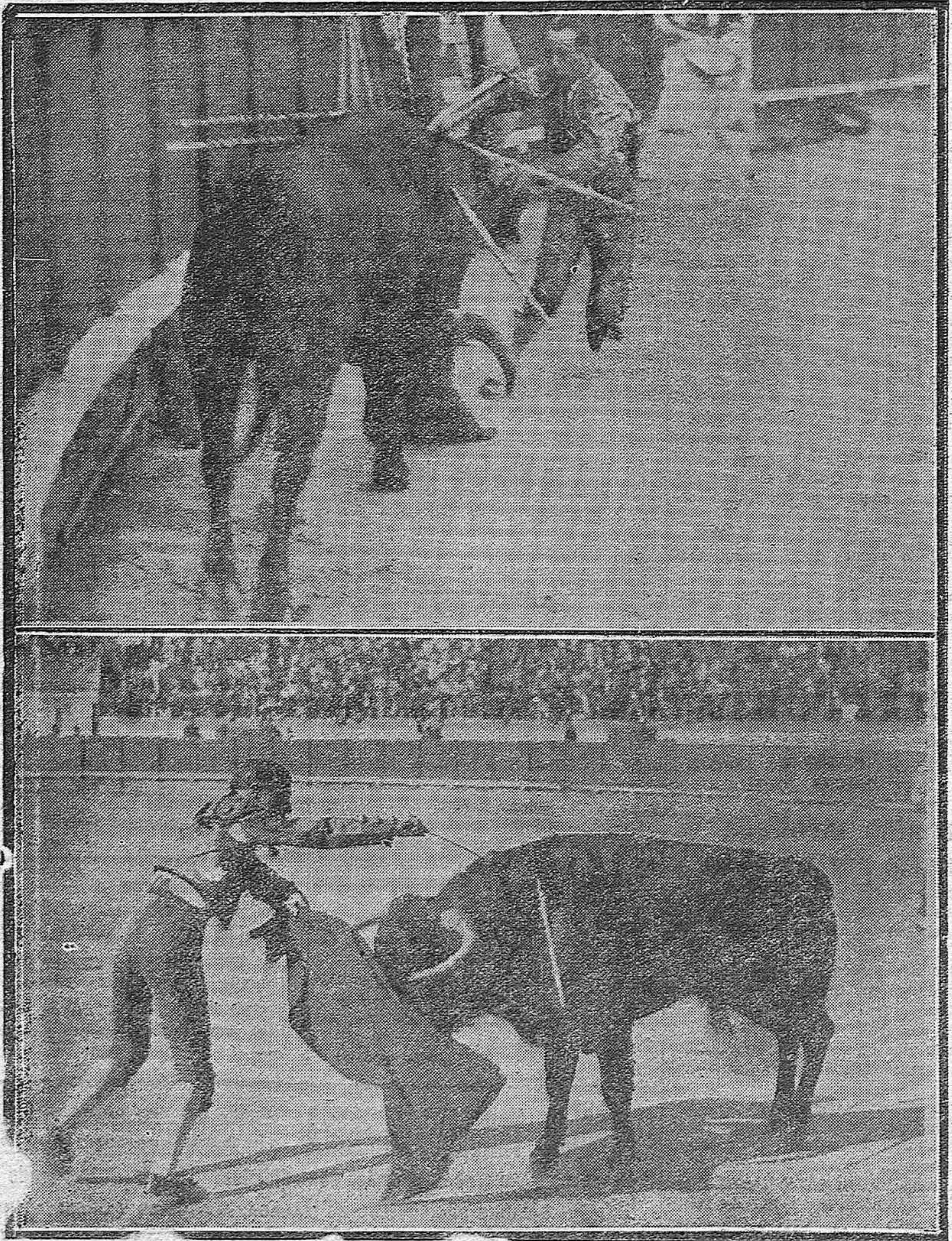
Viruta, debutante con o noville o, matando a su segundo toro.--Camará entrando a matar como no nos tiene acostumbrados.