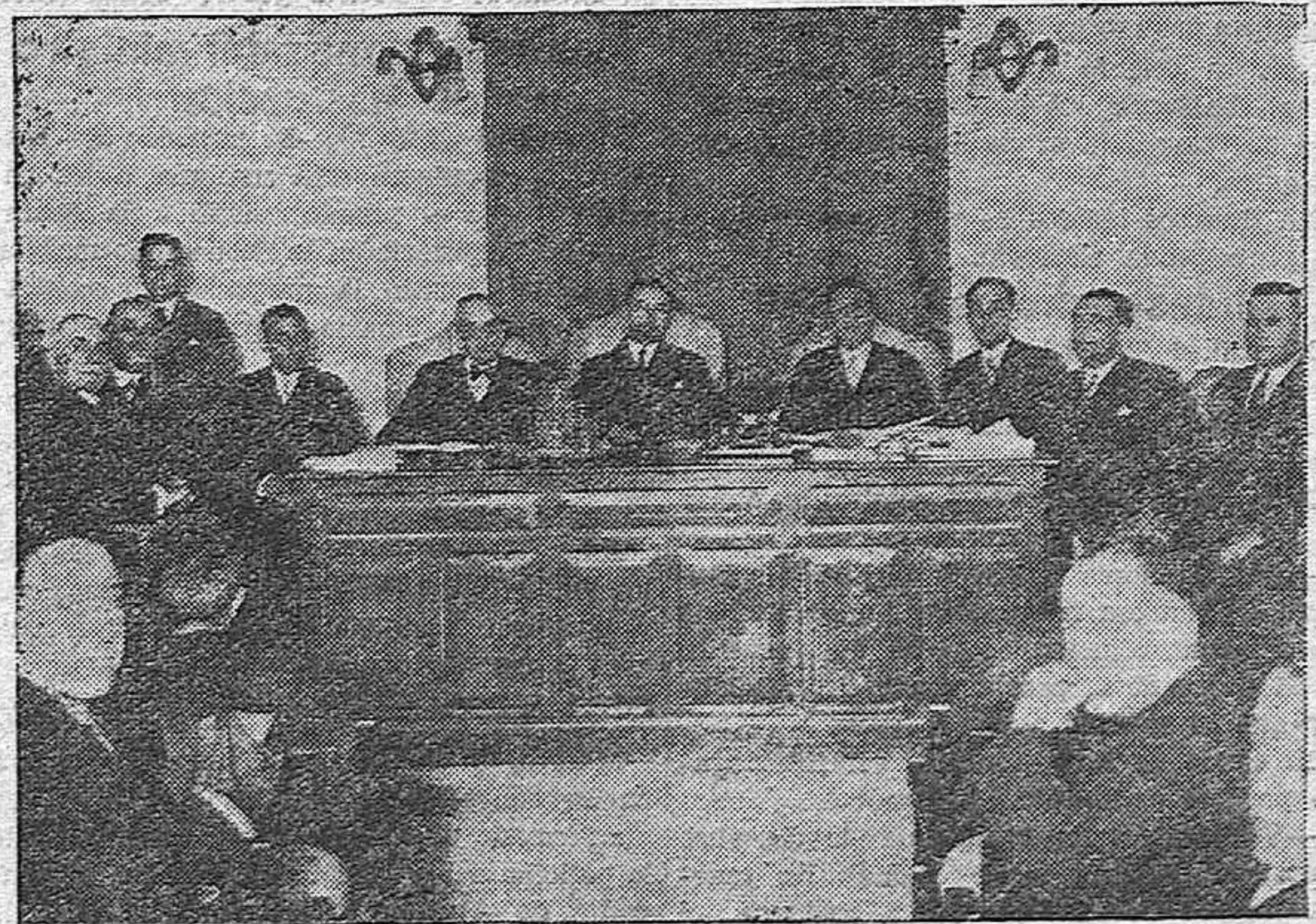
MADRID.—El ministro de Instrucción Pública presidiendo la Asamblea de la Asociación del Magisterio.

El acto dará principio a las diez de la mañana.