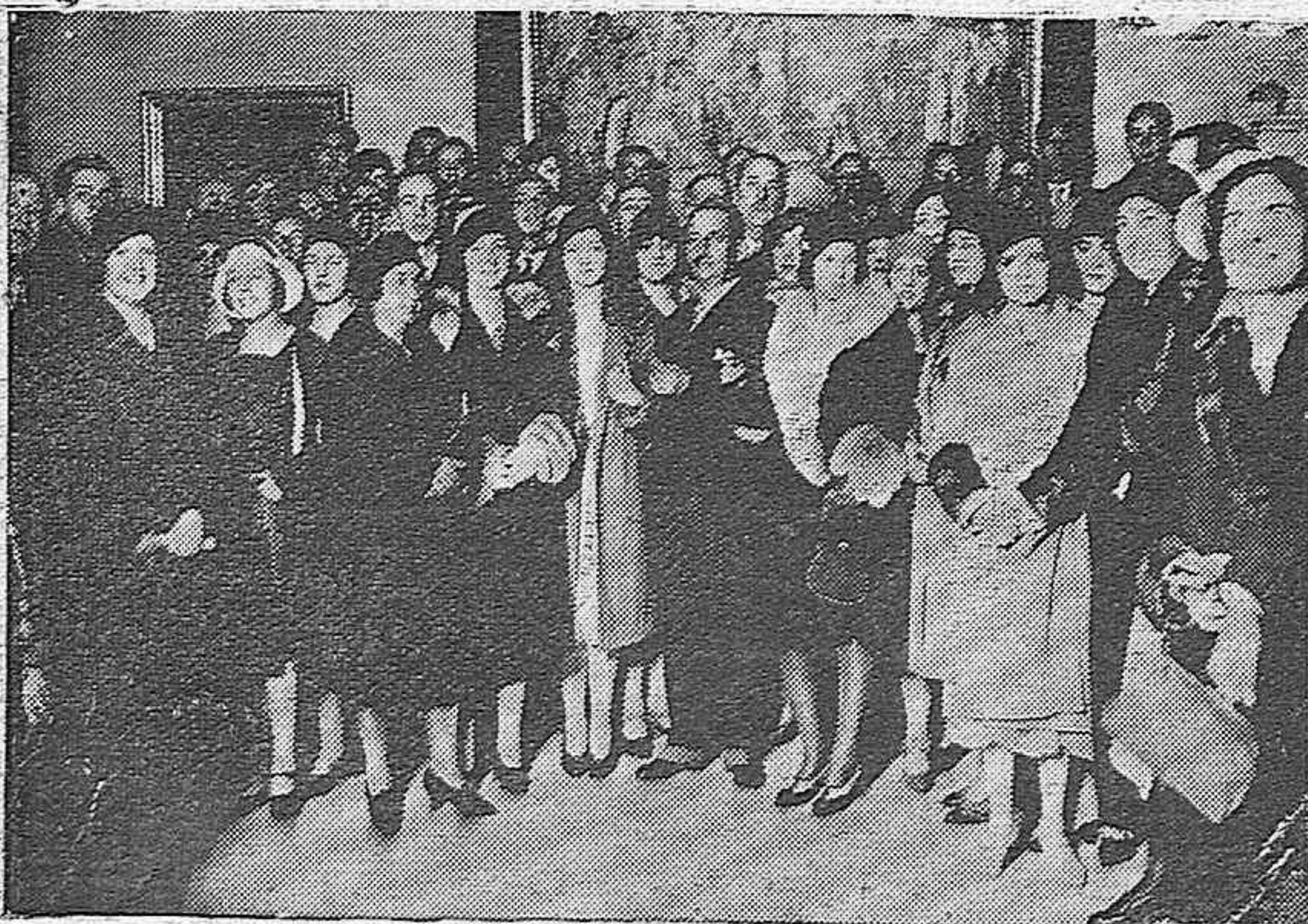
LA CASA DE CORDOBA EN LA EXPOSICION DE SEVILLA. GRUPO DE CONCURRENTES AL ACTO DE LA INAUGURACION, EN EL QUE FIGURABA UNA BRILLANTE REPRESENTACION DE LA BUENA SOCIEDAD CORDOBESA.

OCASION: monos azules y de color, para mecánicos, desde 9 pesetas; trajes hechos, azul firme, desde 11 pesetas, en EL METRO y sus tres Sucursales.