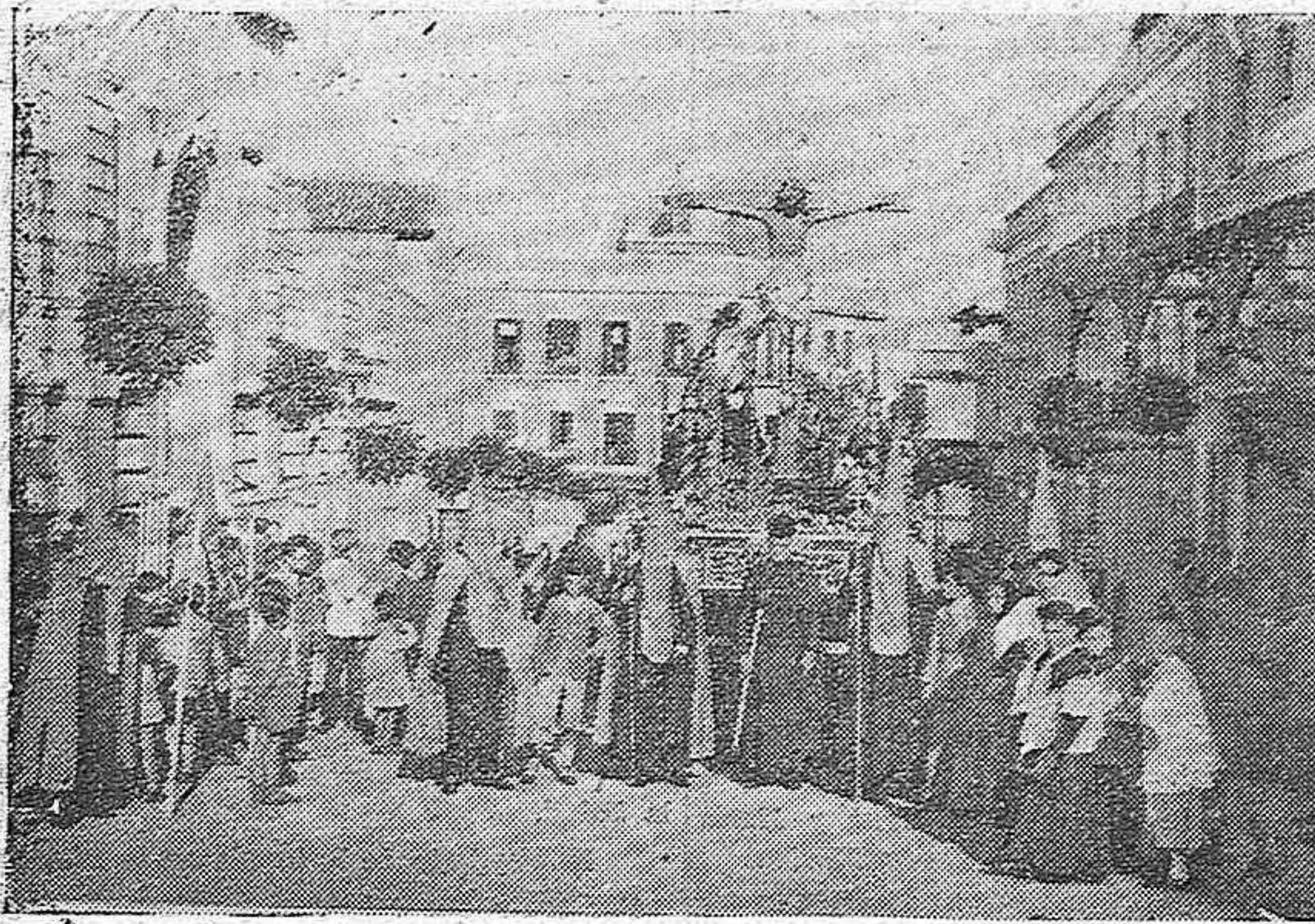
LA PROCESIÓN DEL CRISTO DE LA EXPIRACIÓN, QUE SALIÓ AYER TARDE DE SAN PABLO, INCORPORÁNDOSE DESPUÉS AL SANTO ENTIERRO.