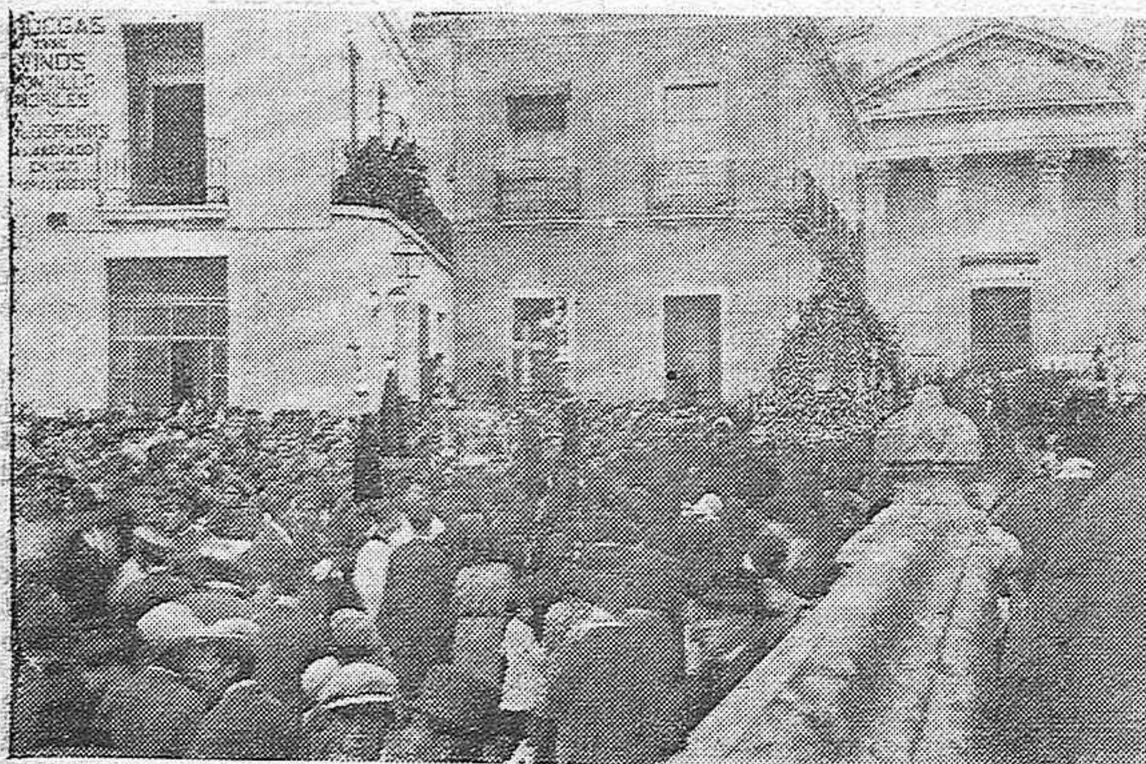
EL SANTO ENTIERRO.—ASPECTO DE LOS ALREDEDORES DE LA COMPAÑIA, AL SALIR AYER TARDE LA PROCESIÓN DEL SANTO ENTIERRO.