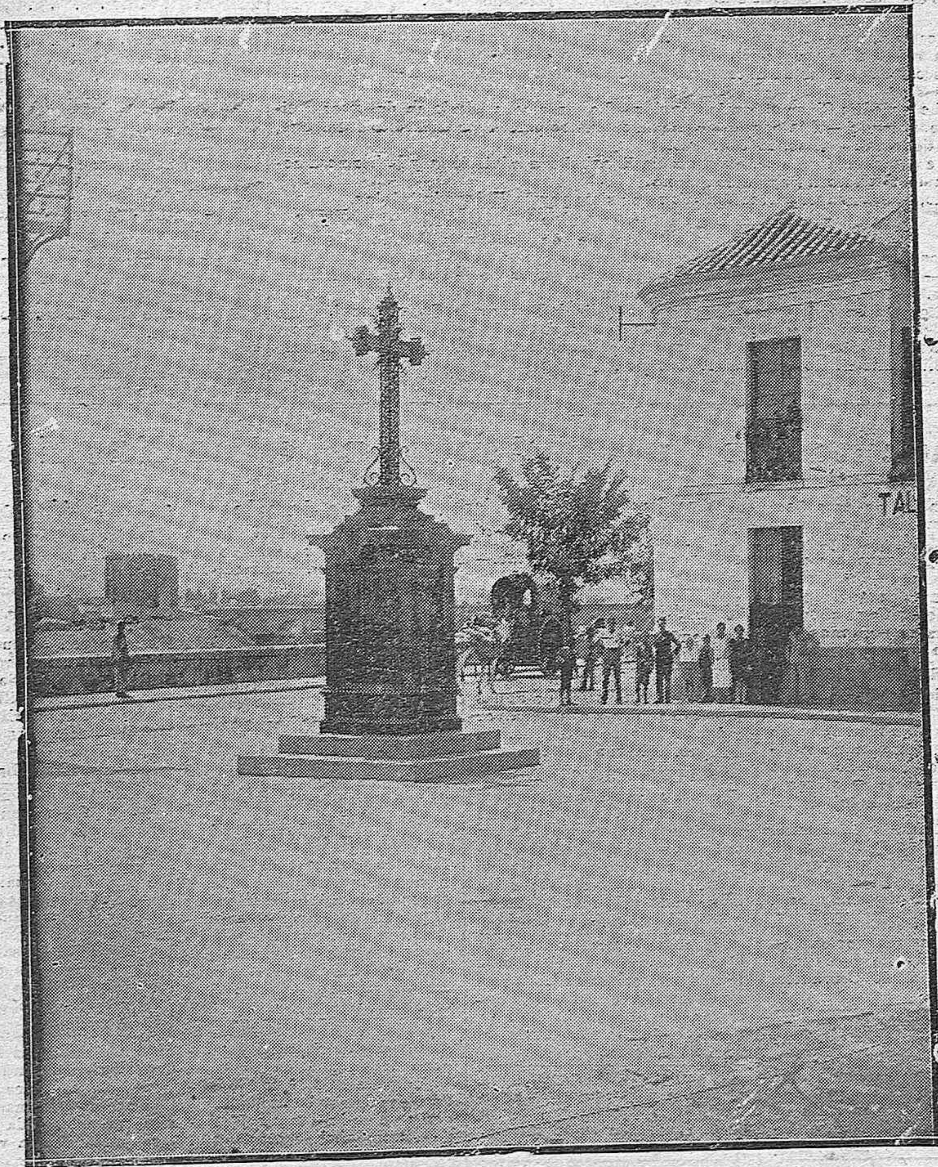
RINCONES CORDOBESES.—Glorieta de la Cruz del Rastro, recientemente reformada.