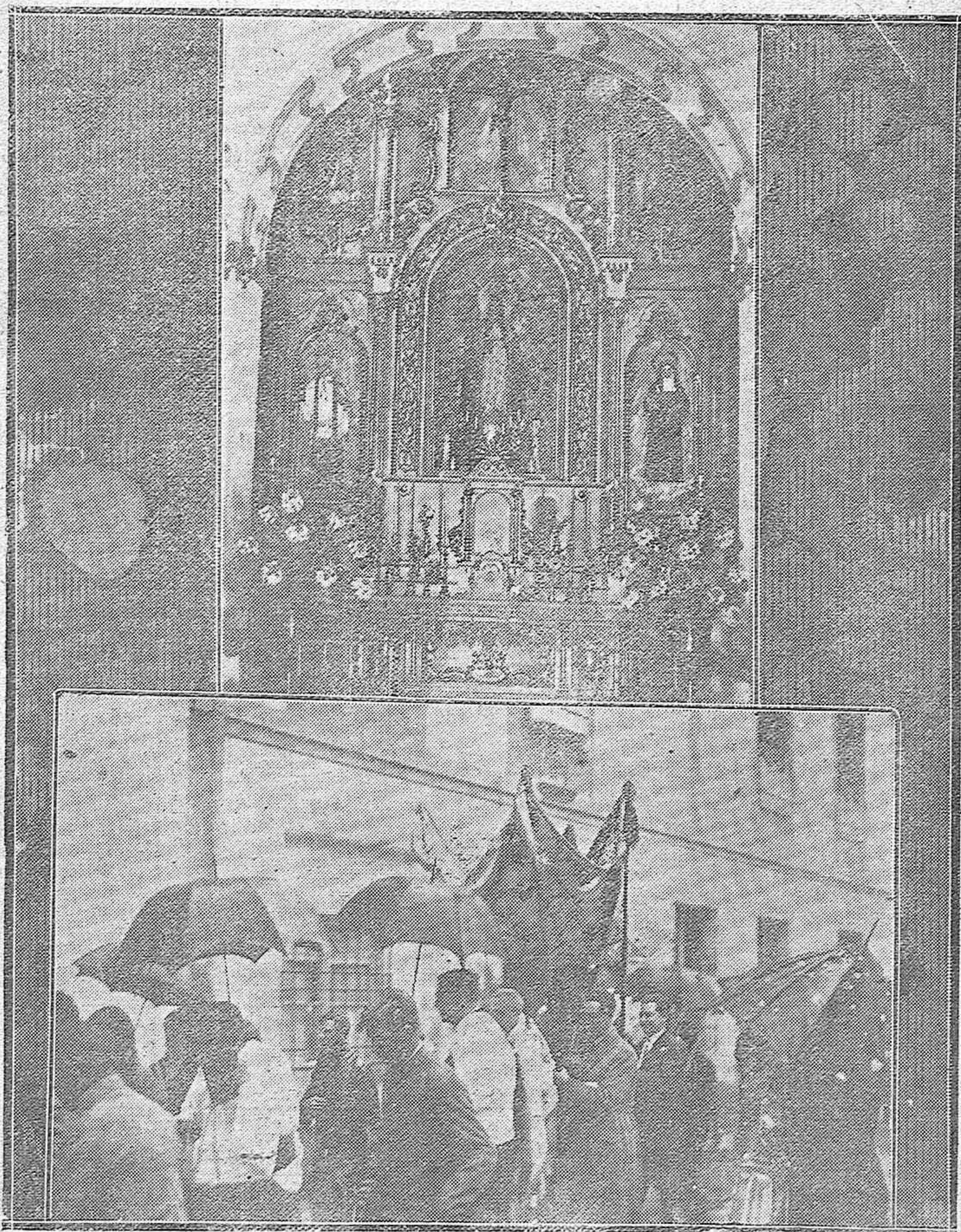
De la inauguración de una Capilla en el Hospital de Crónicos inaugurada ayer con motivo de dar el Viático a los enfermos. — El Viático al llegar al Hospital de Crónicos, llevando el paflo los médicos de la Beneficencia Provincial.