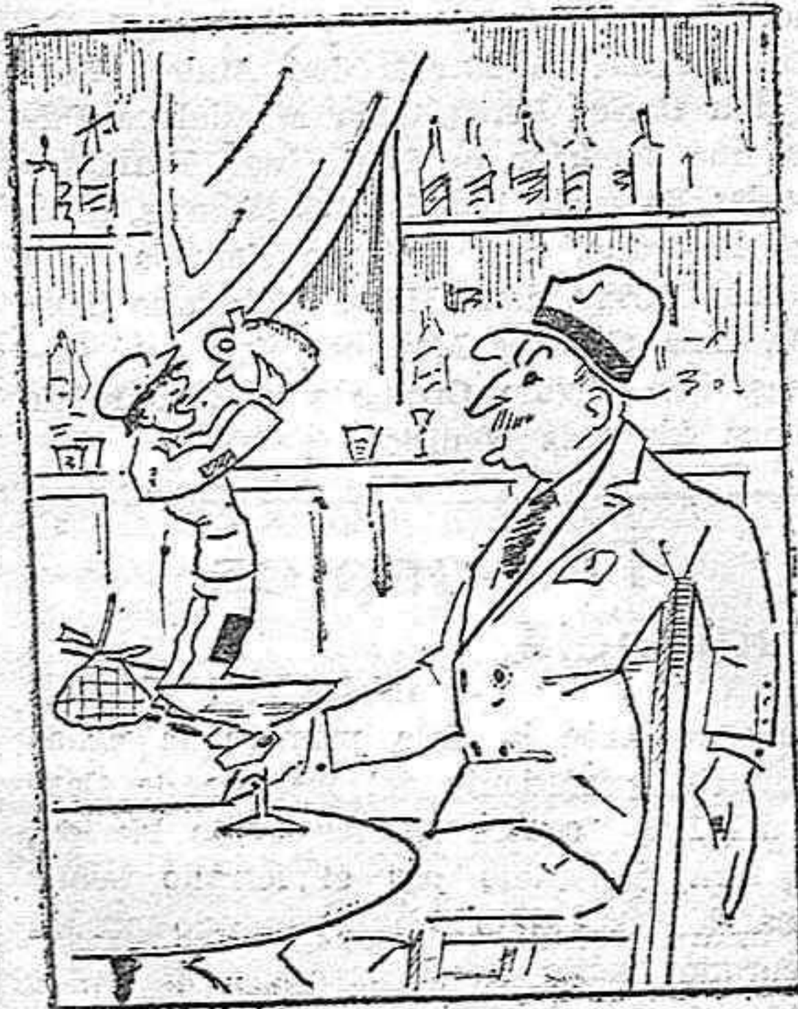
Bebe el rico y bebe el pobre.