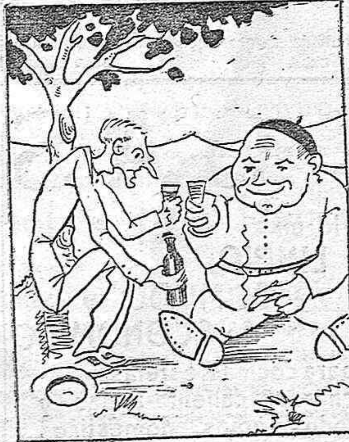
Bebe el gordo y el "delgao".