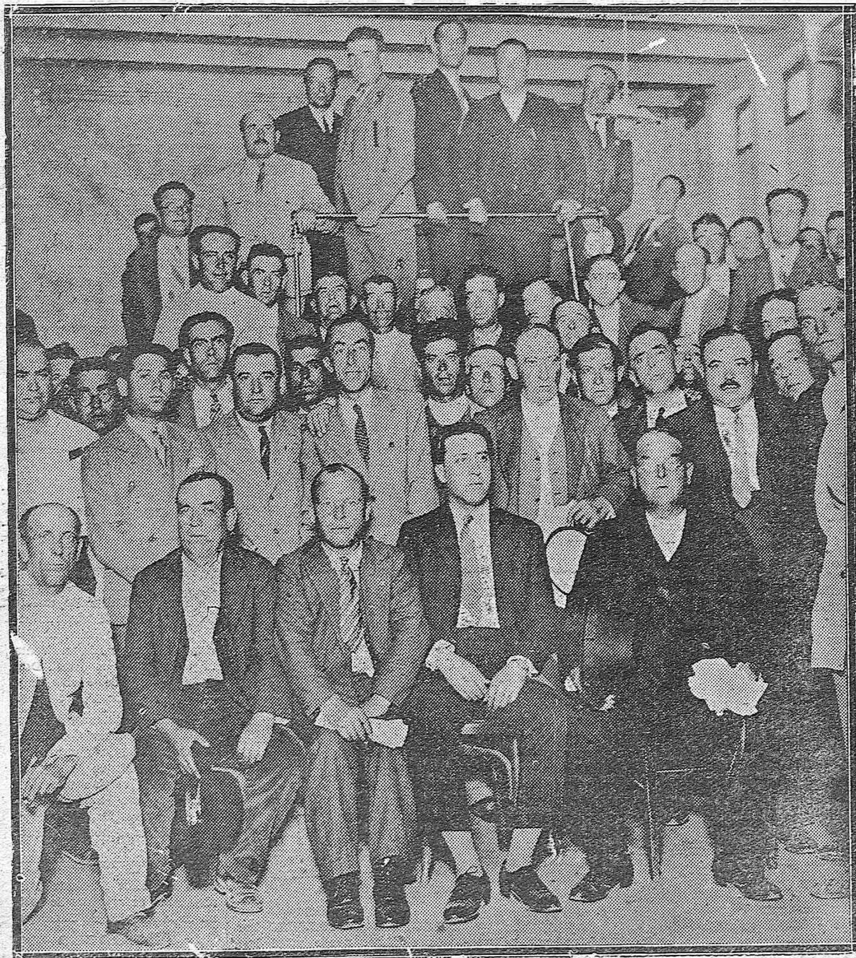
EN LA CASA DE "LA VOZ".—Grupo de asistentes al Congreso Republicano Autónomo durante la visita que hicieron ayer a los talleres de nuestro periódico