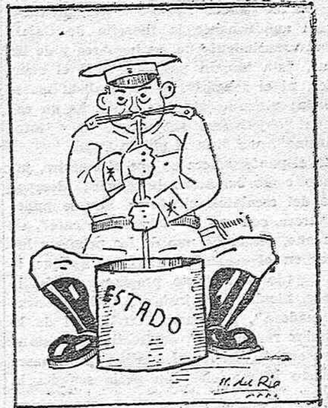
Pero este no bebía que "chupaba del estao."