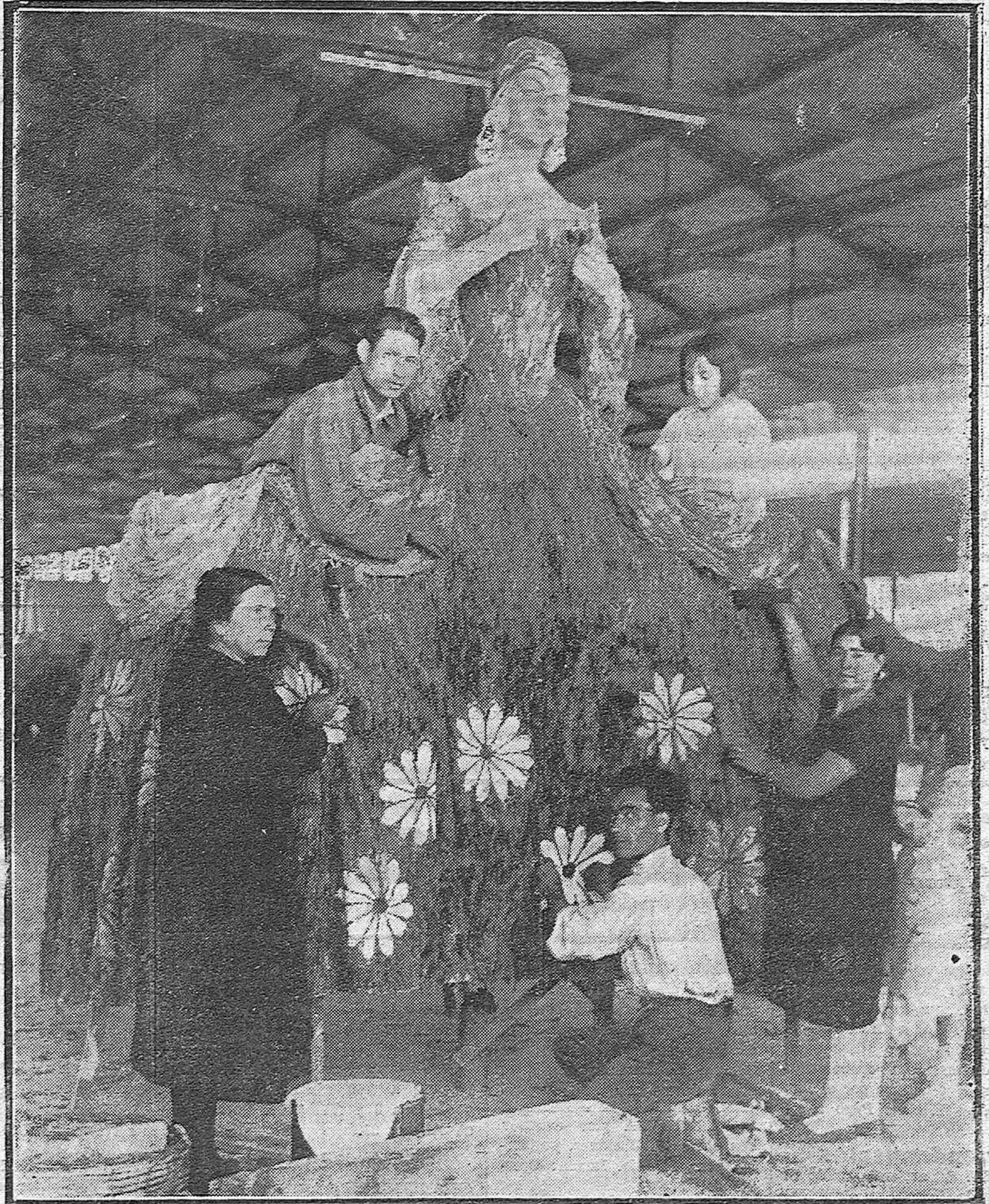
PARA LA BATALLA DE FLORES.—Los artistas valencianos del Maestro Cortina, preparando la carroza de Madame Pompadour, una de las más interesantes del festivo cortejo.