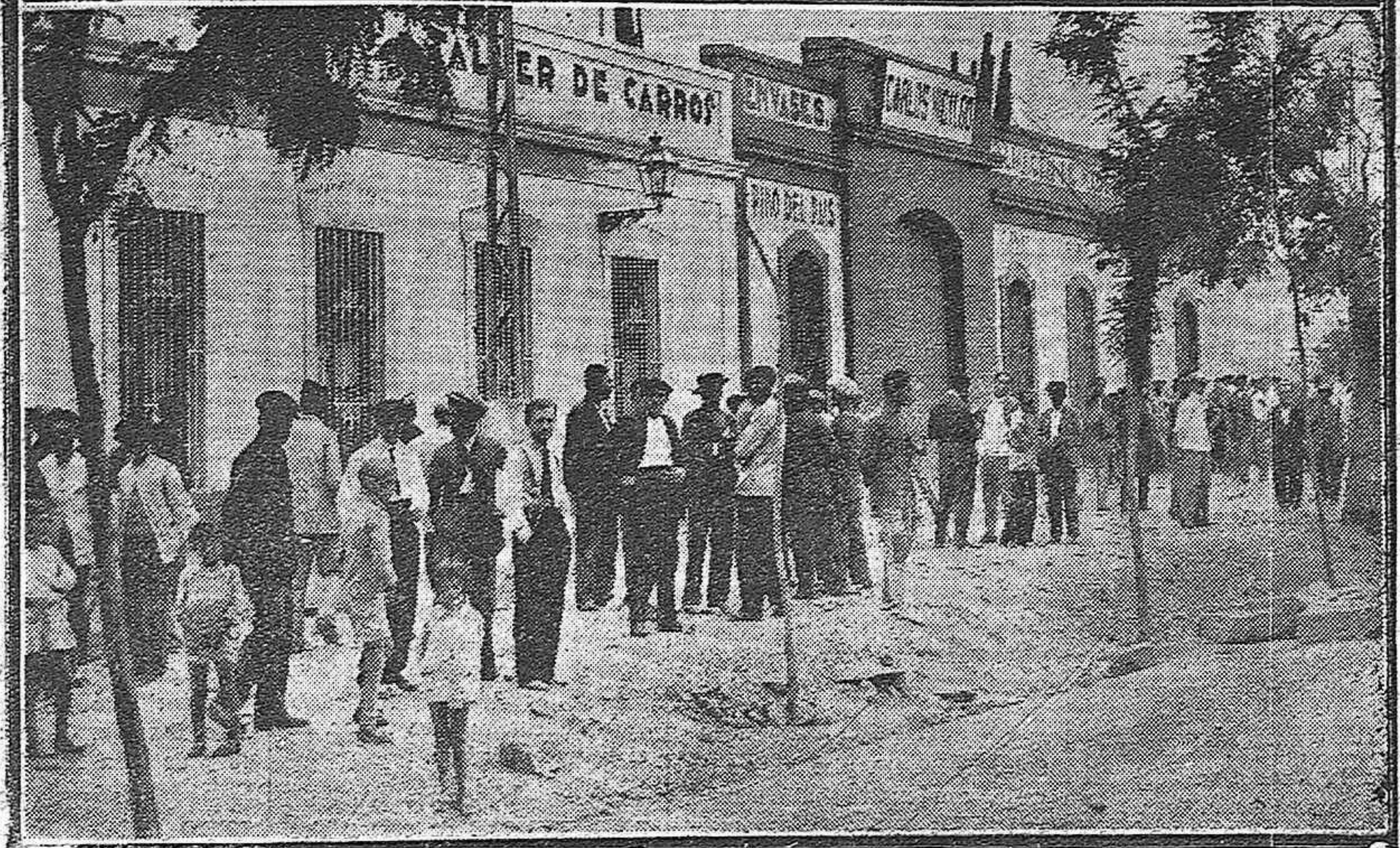
Vista del Convento y explanada de San Cayetano donde se desarrollaron los sucesos de anoche. El público estacionado en la acera de las Ollerías, donde cayeron las primeras víctimas