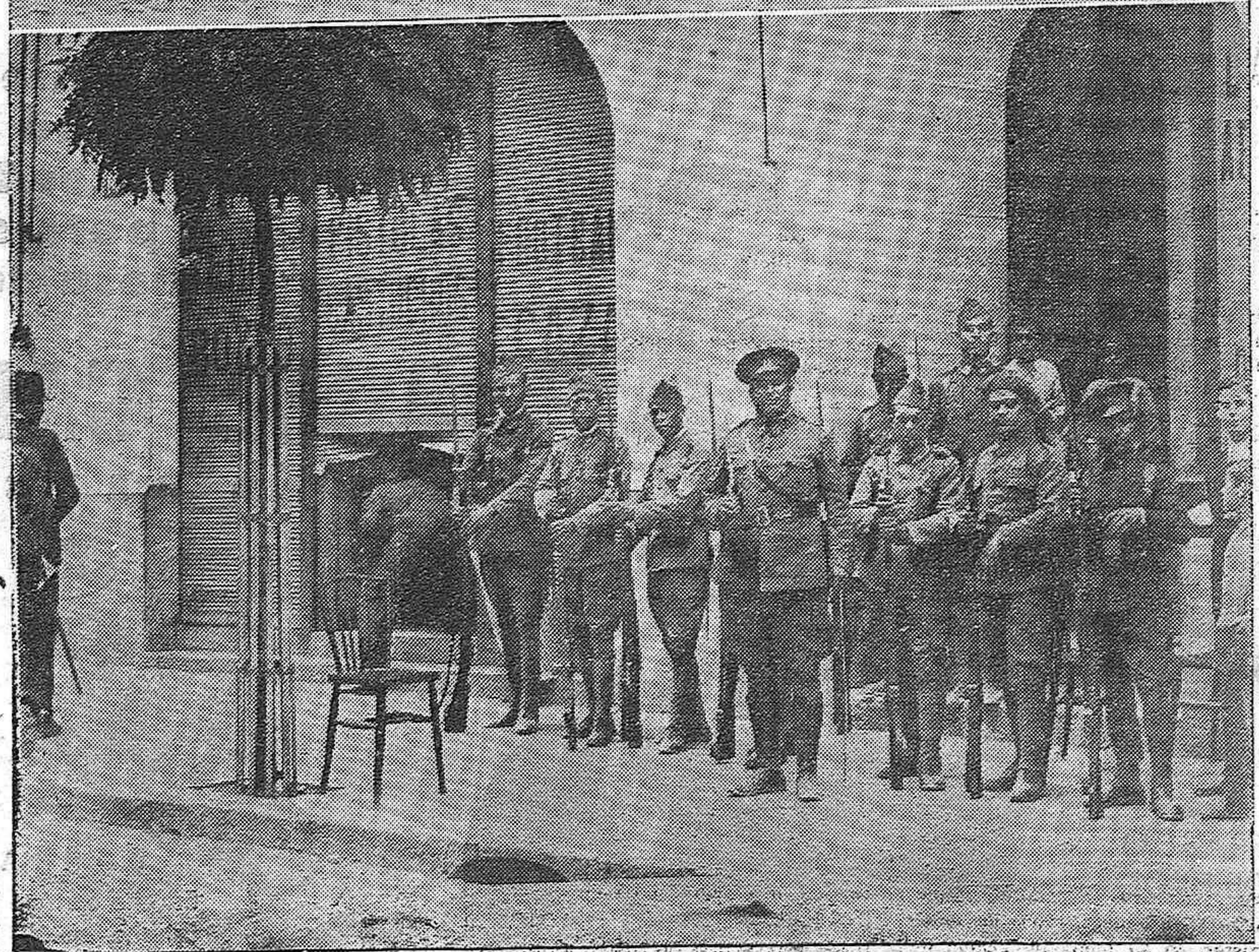
Fuerzas de infantería custodiando la iglesia de Santa Marina.—La armería "El Sport" que fué asaltada por los revoltosos apoderándose de armas y municiones