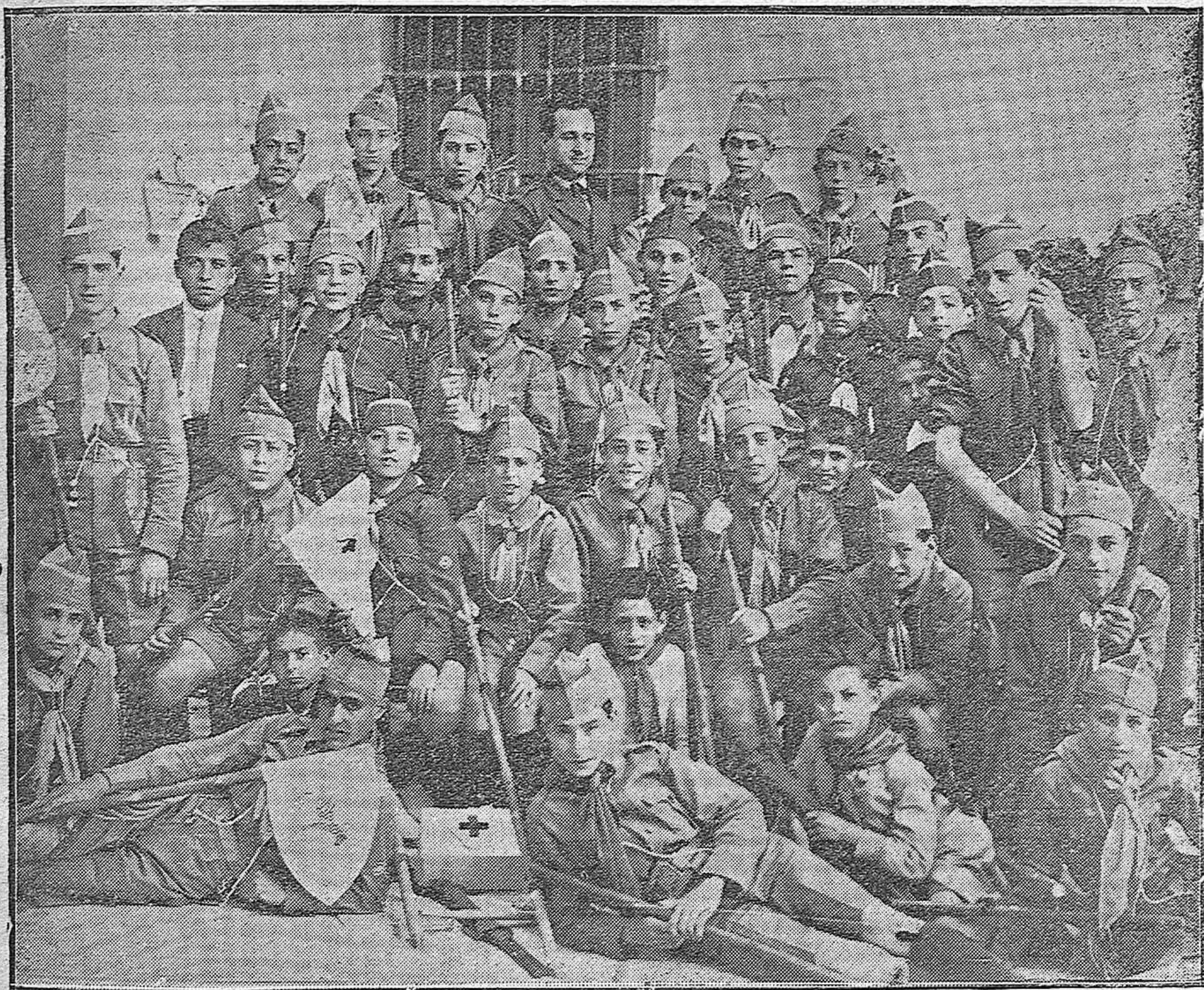
Grupo de exploradores cordobeses que forman la Sección de Córdoba, recientemente organizada.