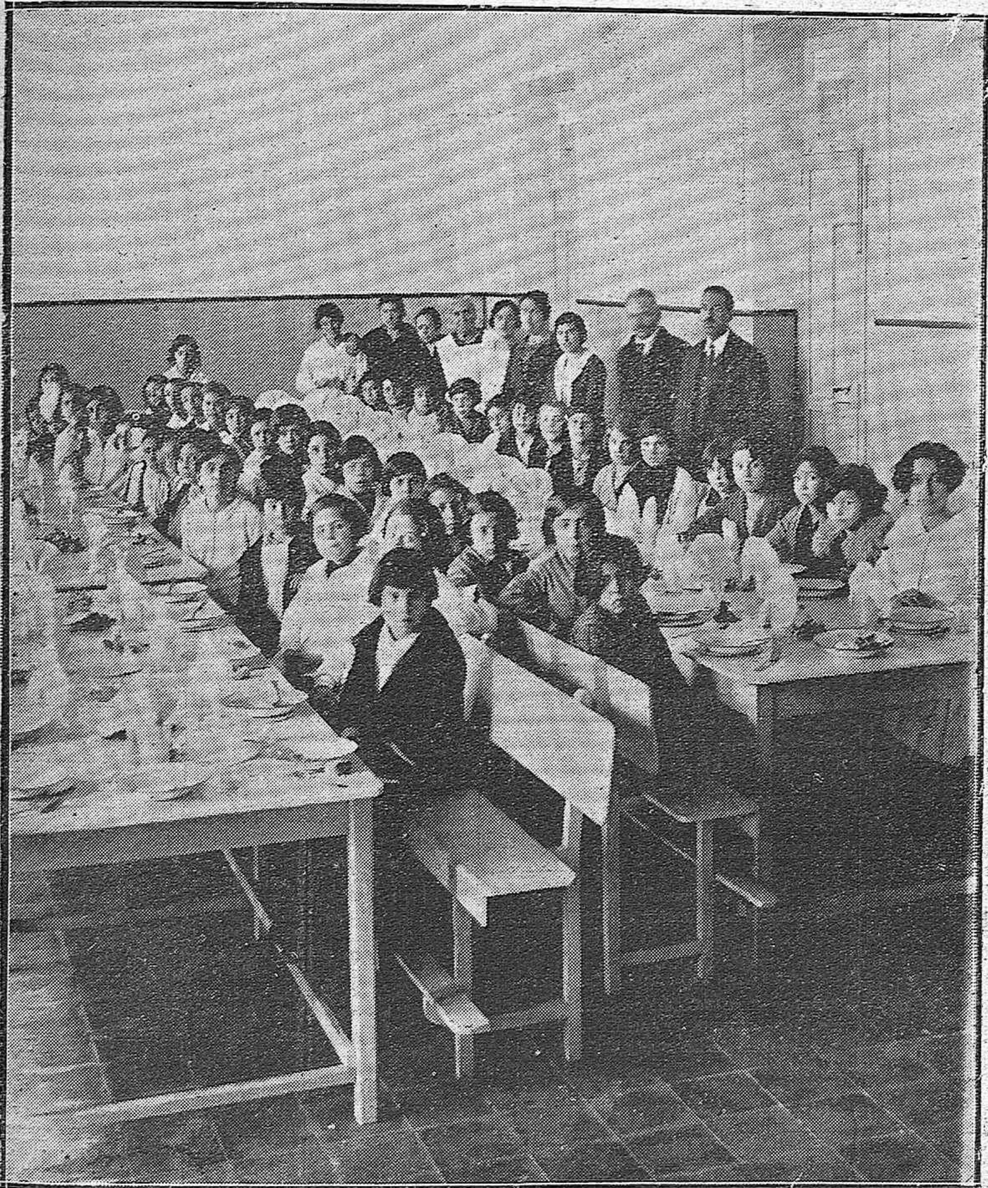
INAUGURACIÓN DE LA CANTINA ESCOLAR DE NIÑAS EN EL GRUPO ESCOLAR «MARQUES DE ESTELLA».