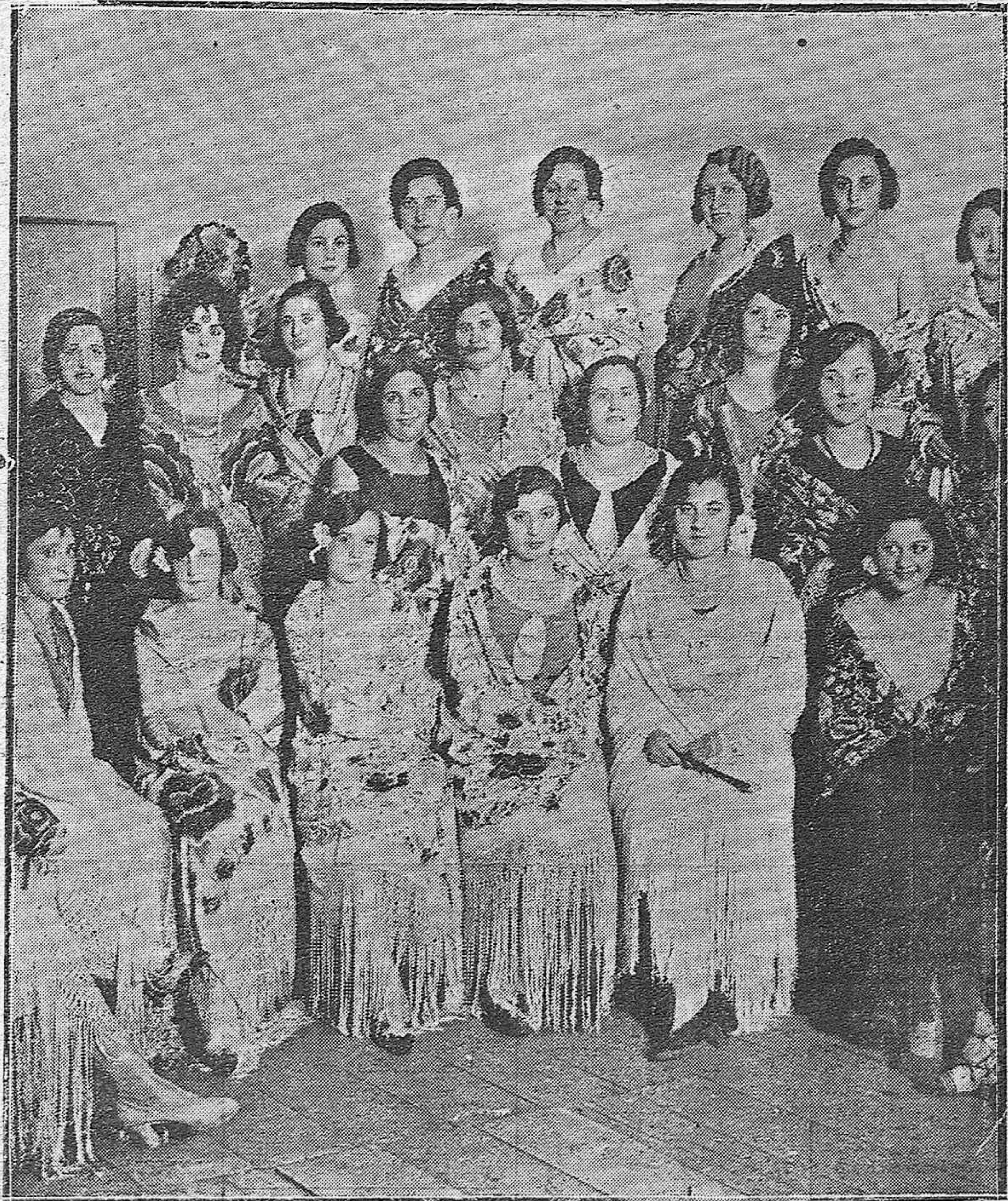
LA NOCHE DE SAN PEDRO. — CONCURSO DE MANTONES DE MANILA CELEBRADO EN EL CENTRO FILARMONICO EDUARDO LUCENA. — BELLISIMAS SEÑORITAS QUE TOMARON PARTE EN DICHO CONCURSO.