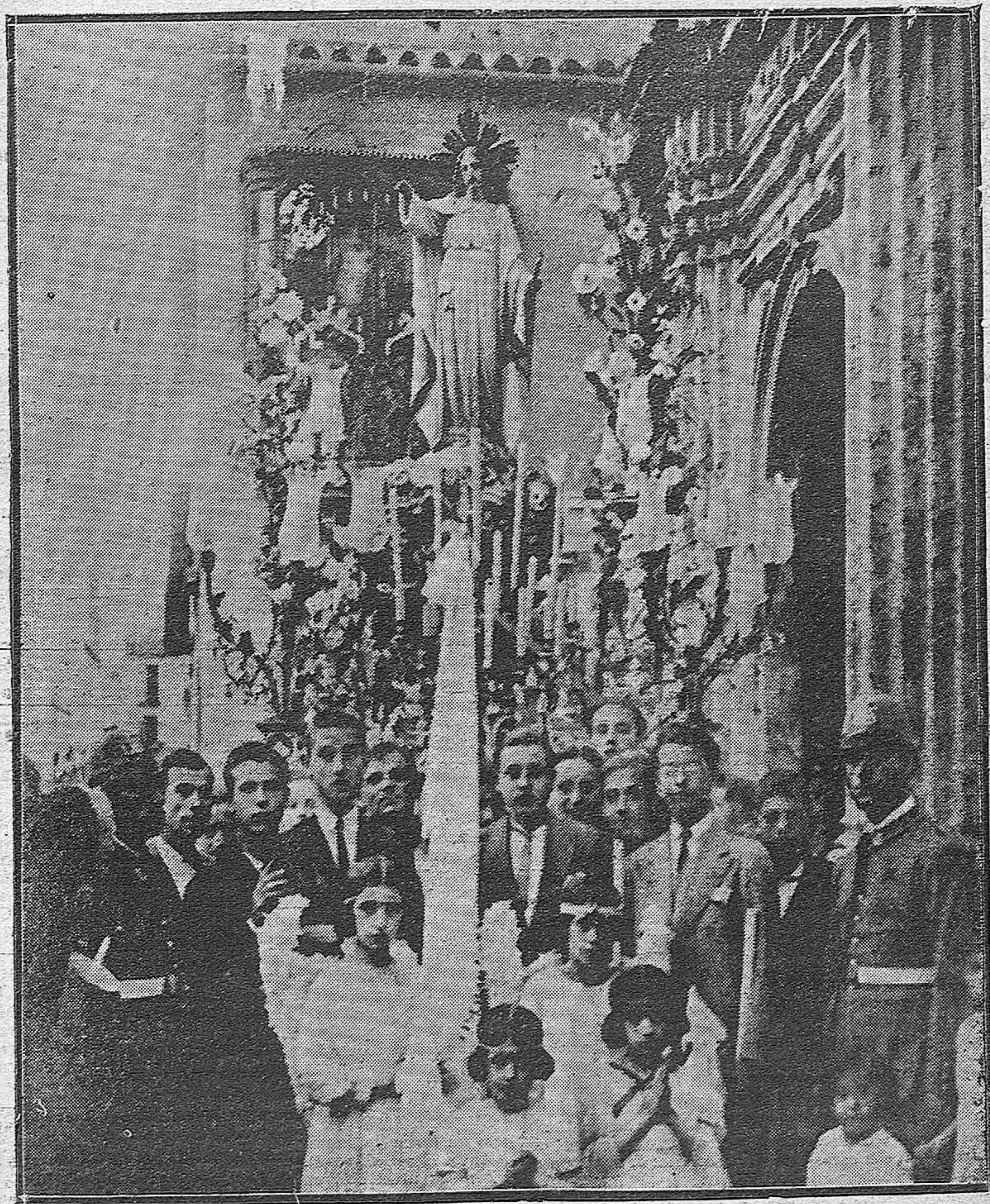
LA FESTIVIDAD DE AYER. — LA SOLEMNE PROCESIÓN DEL CORAZÓN DE JESÚS QUE SALIÓ DE LA IGLESIA DE SAN FRANCISCO.