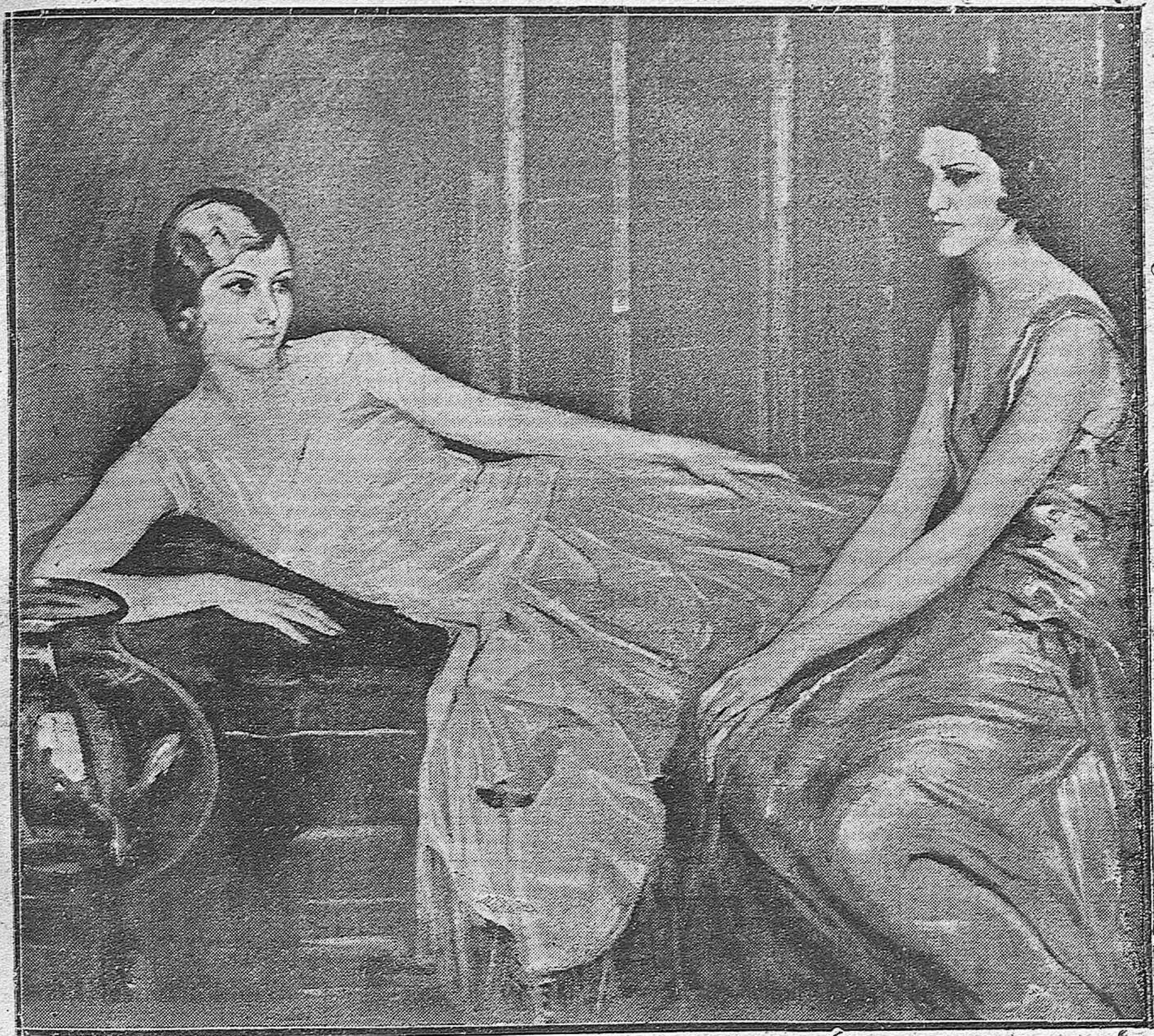
«LUZ Y ELENA», BELLÍSIMO LIENZO DE LEÓN ASTRUC, PREMIADO CON TERCERA MEDALLA EN LA EXPOSICIÓN NACIONAL DE BELLAS ARTES.