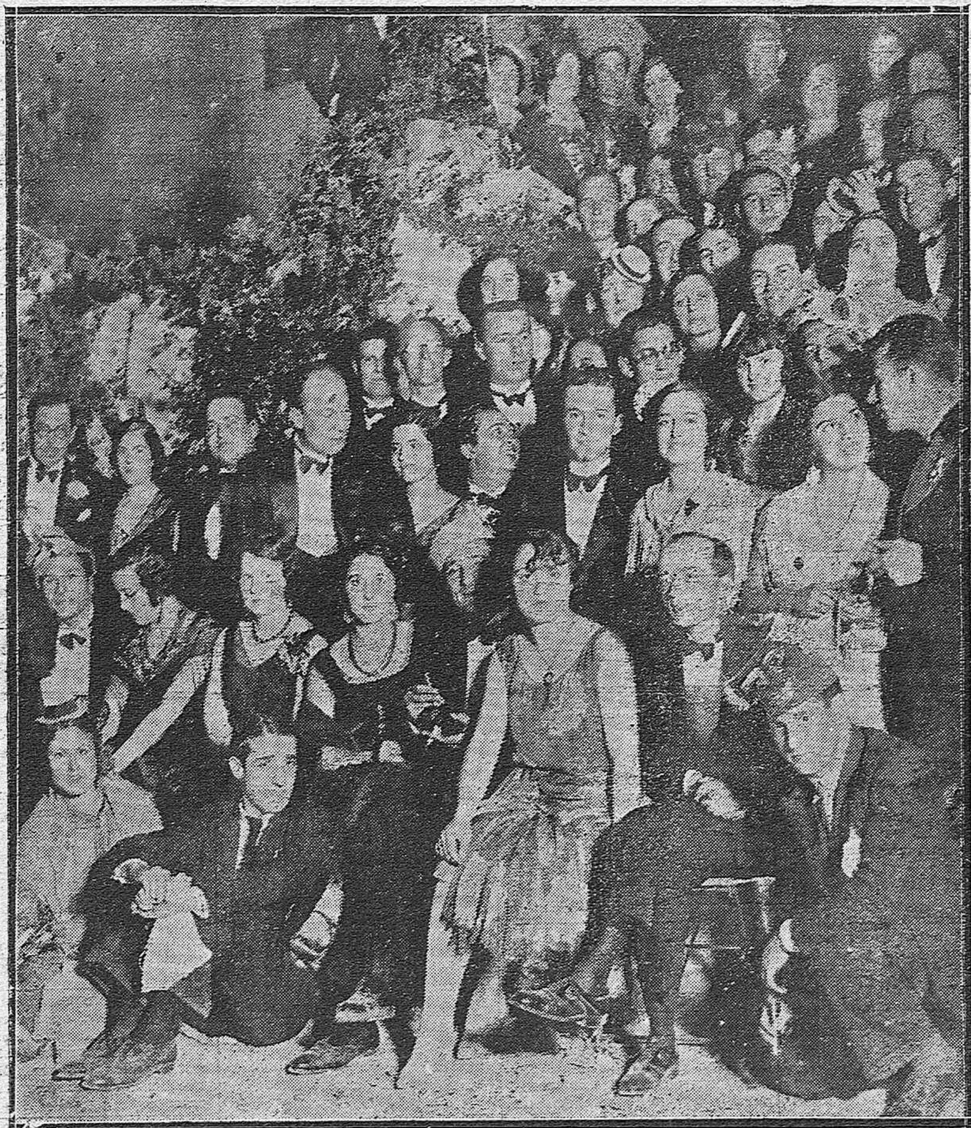
UN MOMENTO DE LA ANIMADÍSIMA VERBENA ORGANIZADA EN LA FINCA BALLESTEROS.