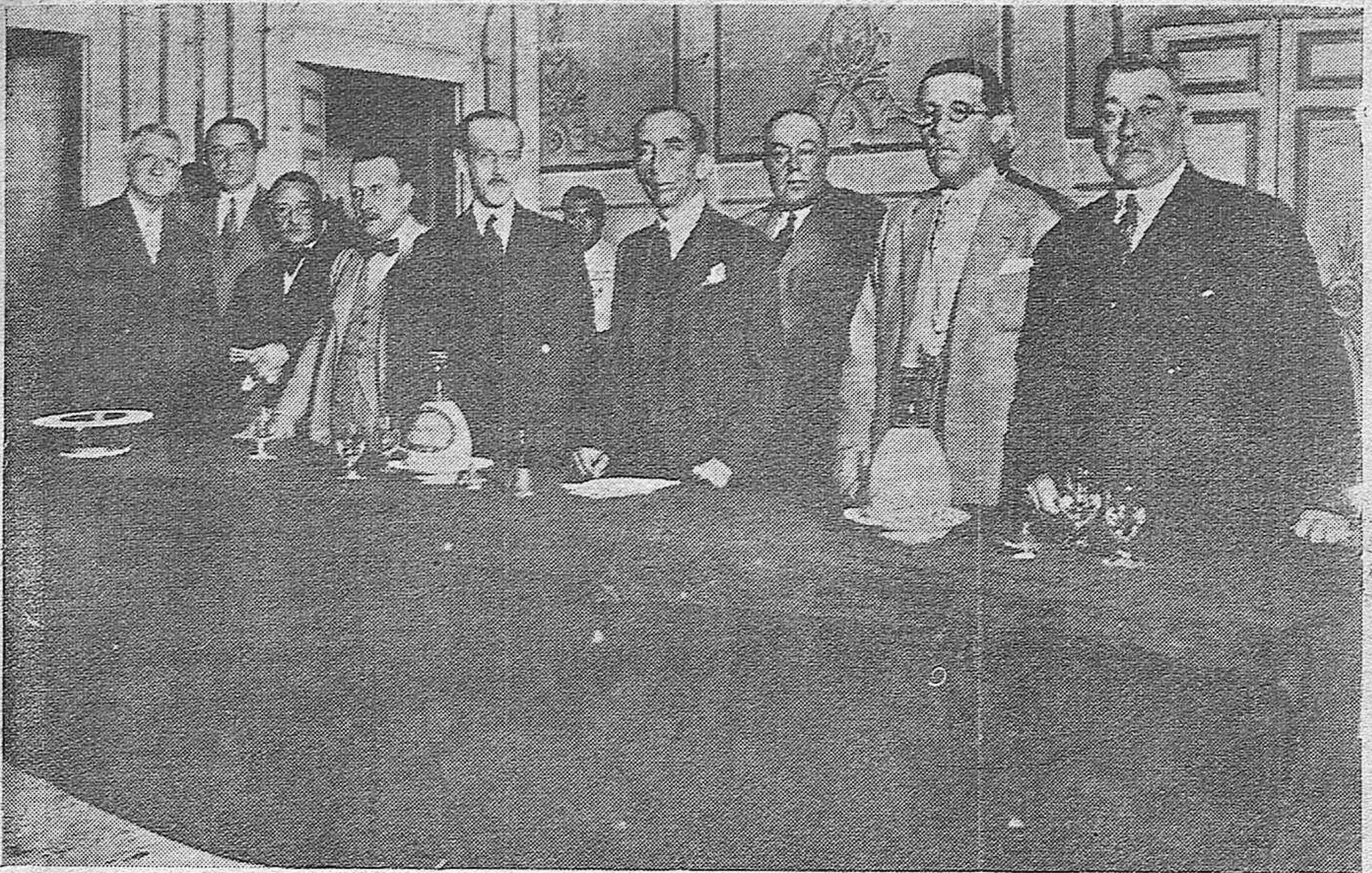
EN EL GRAN TEATRO.—LA ASAMBLEA DE OLIVAREROS, CELEBRADA AYER CON ENORME CONCURRENCIA, —PRESIDENCIA DEL ACTO.