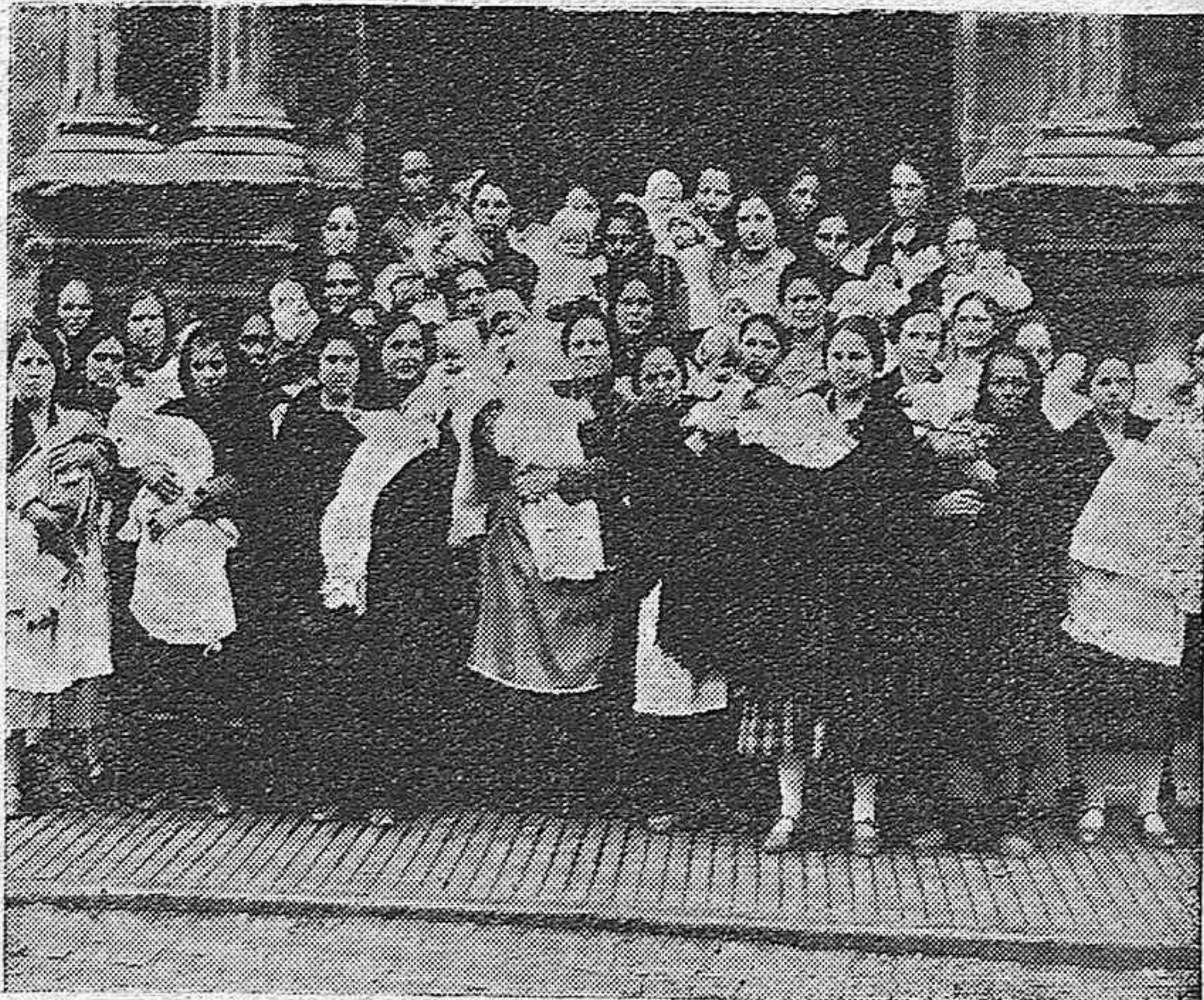
MONTORO.—Grupo de obreras madres que han cobrado el subsidio

que más se agradece es una pluma stilográfica "Watermans". Magnífico surtido. Vea nuestros escaparates LIBRERIA LUQUE. Diego León, 8