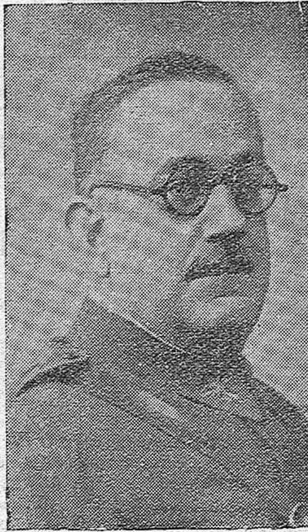
El Gobernador militar de Huesca, general Las Heras que ha fallecido esta mañana

Por su exquisito aroma y excelente paladar se distinguen de los demás. Esta casa tuesta a diario las clases más selectas. G. de los Ríos, 34. Esquina a Regina. Teléfono, 21-10. Córdoba.