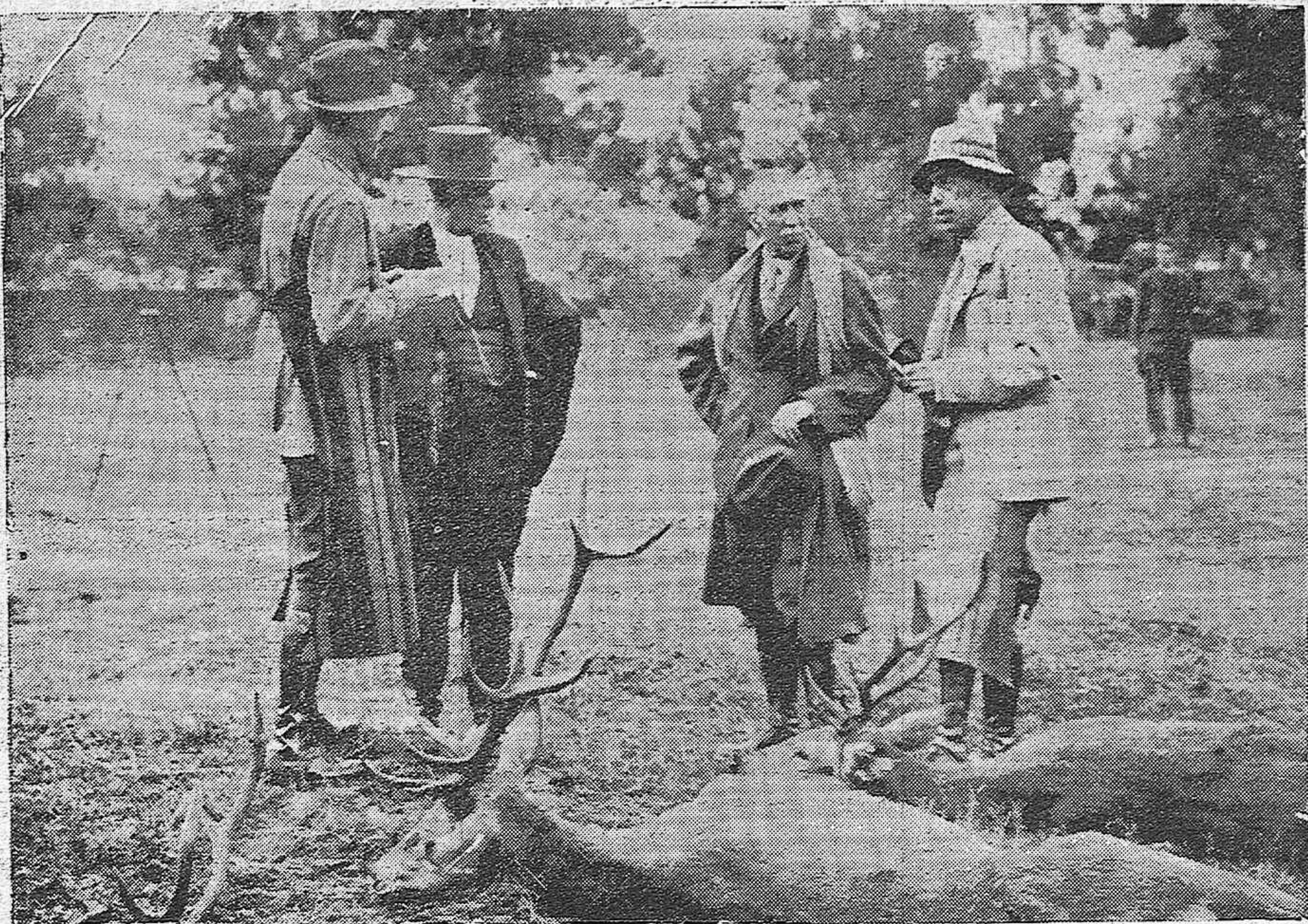
CORDOBA.—La cacería regia en Hornachuelos.—Su Majestad el Rey con varios cazadores, viendo las reses cobradas