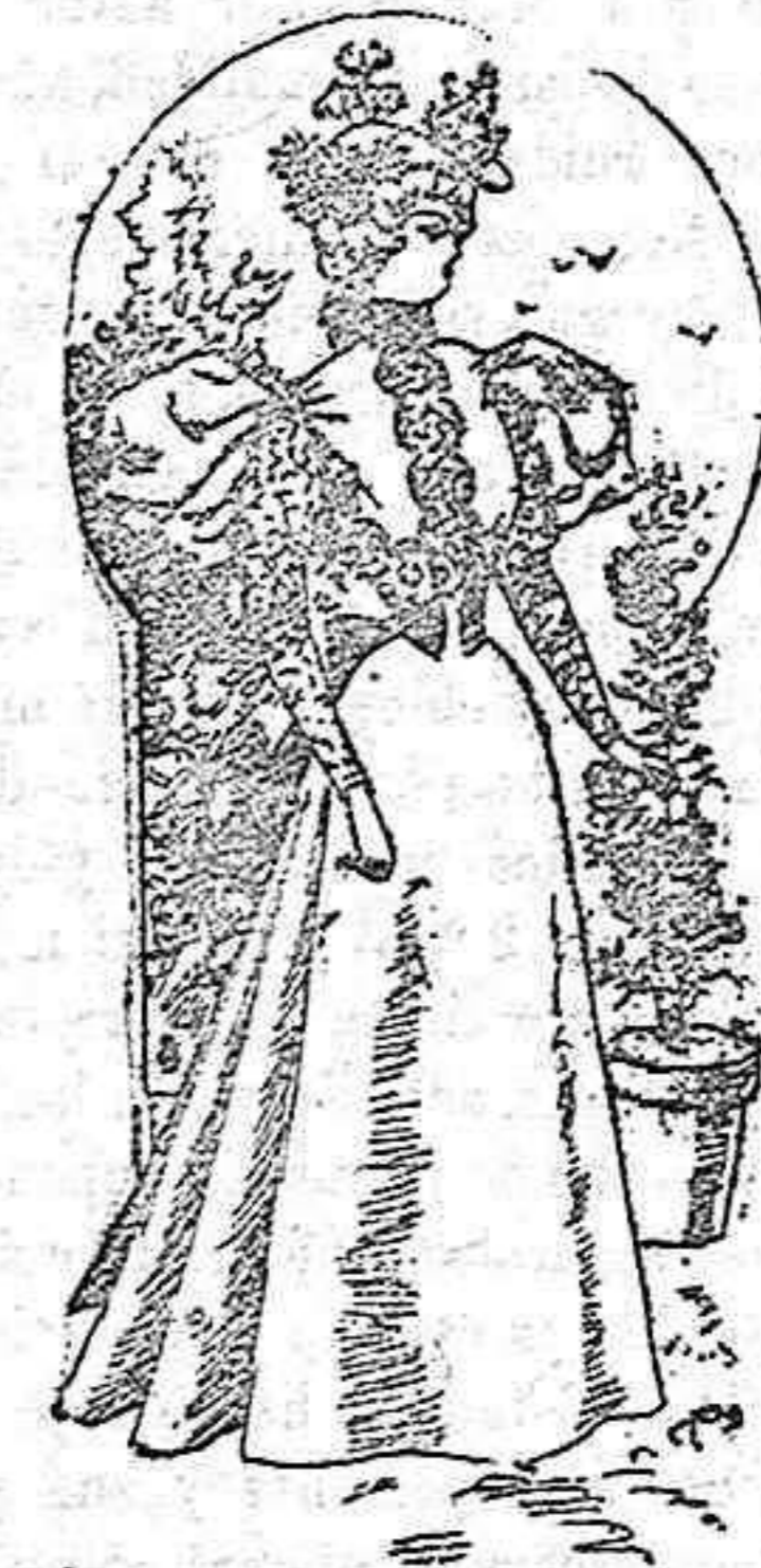
Traje de entretiempo.

Es de seda chiné, última novedad; cuerpo ceñido al talle, de encaje con aldetas, abierto en el delantero sobre un canesú de muselina de seda abollada; dos tiras de cinta glasé recogidas en el hombro, con un bonito Chus , finalizando en el talle con dos botones. Cuello alto con una ruxa de muselina, manga último modelo, estrecha, con un bollo en la bocamanga; lleva una ruxa de muselina de seda; falda lisa forma campana.