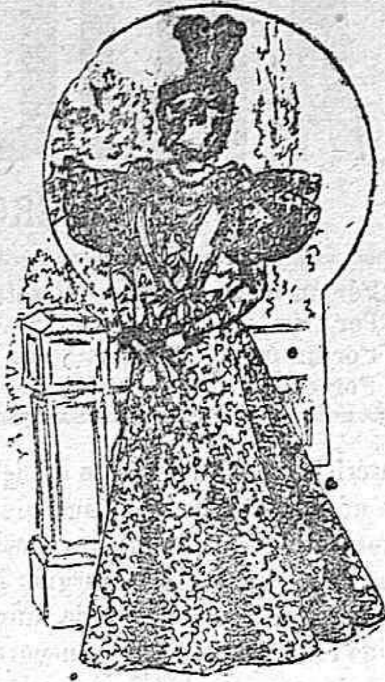
Traje para visita.

Modelos exclusivos para nuestras lectoras, de los grandes almacenes de «El Siglo», Barcelona.