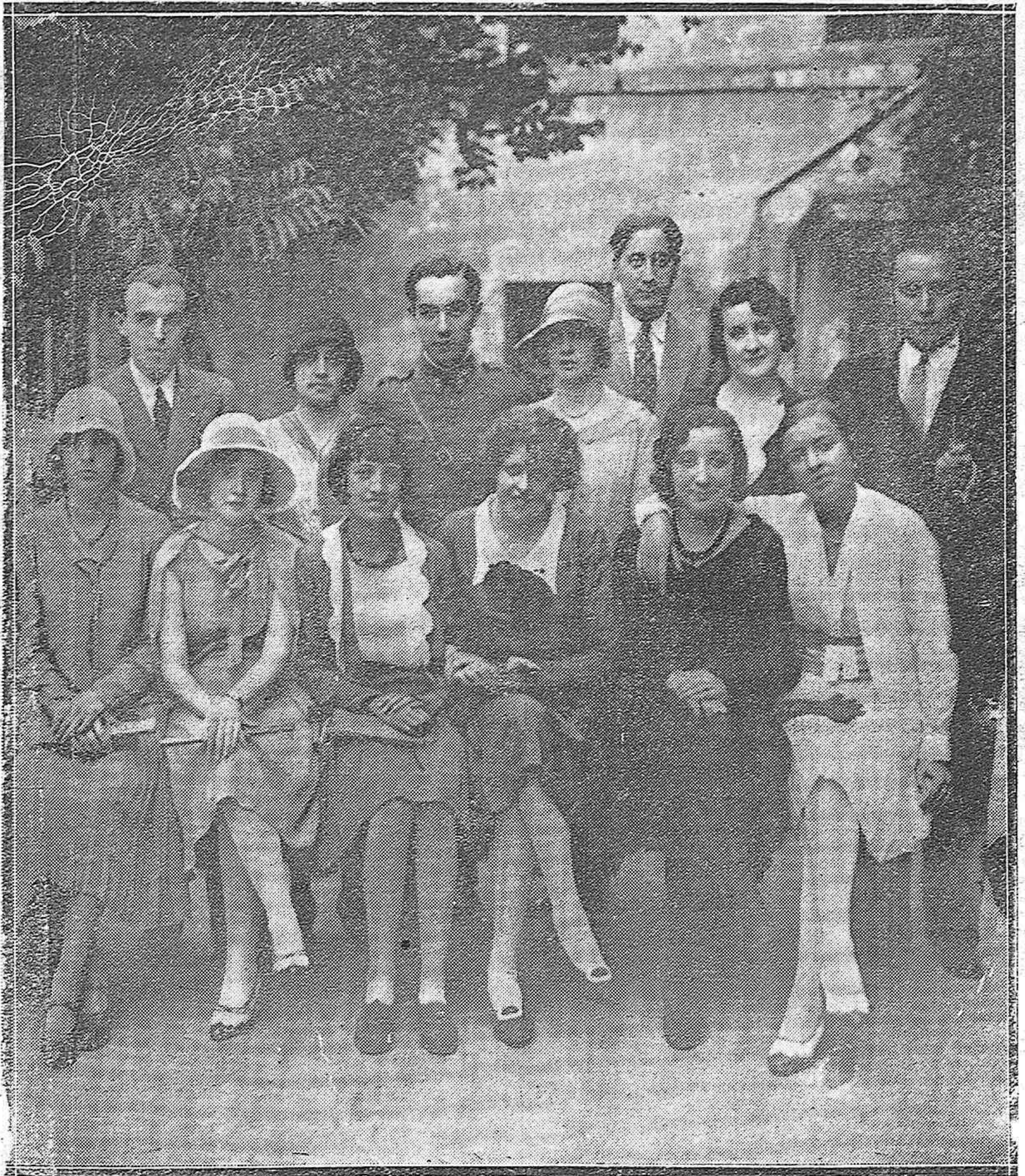
EL CURSO ACADÉMICO DE ESTE AÑO.—BELLÍSIMAS SEÑORITAS QUE ASISTIERON A LA PASADA APERTURA DEL CURSO