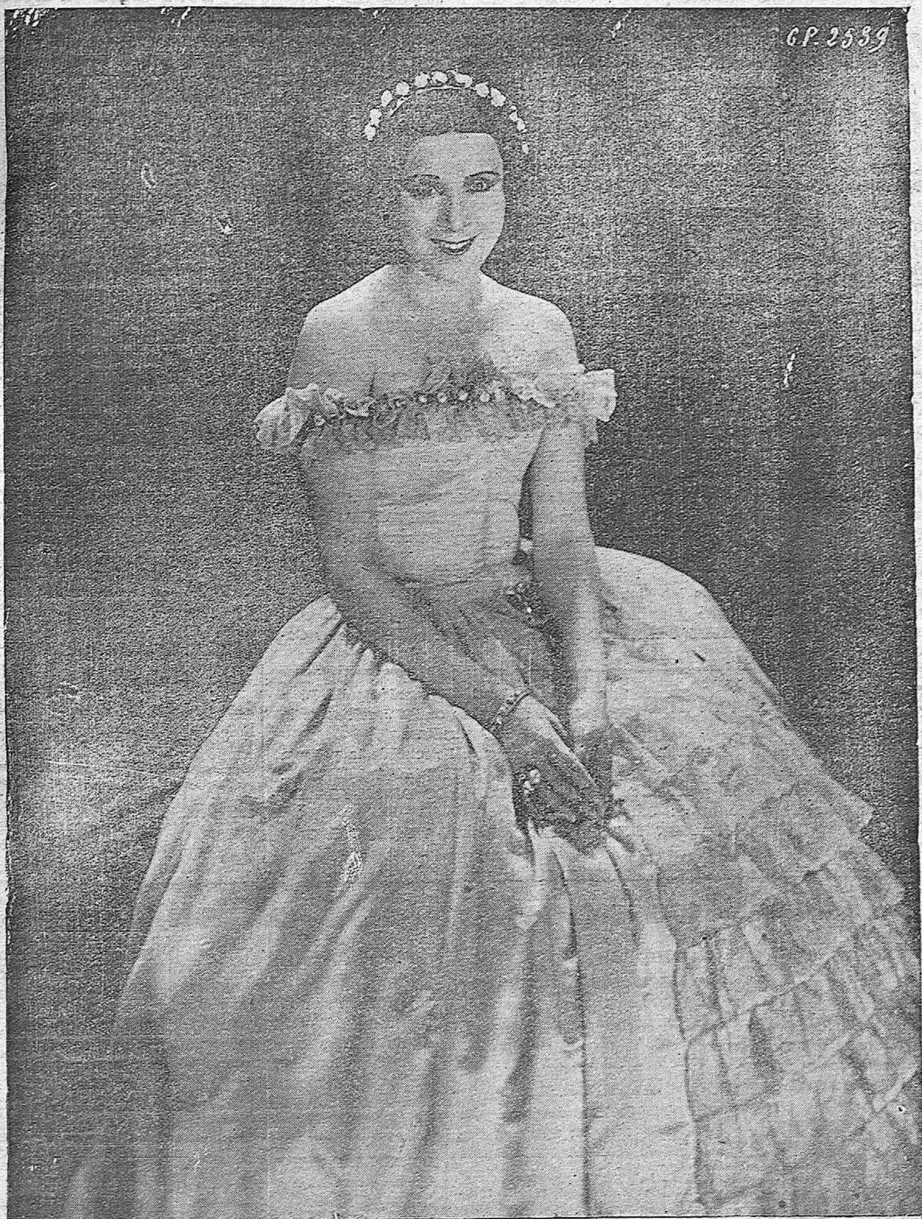
ARTISTAS DE LA PANTALLA.—La popular y gentil artista española Enriqueta Serrano que ha sabido destacarse como "star" cinematográfica habiendo obtenido grandes éxitos.