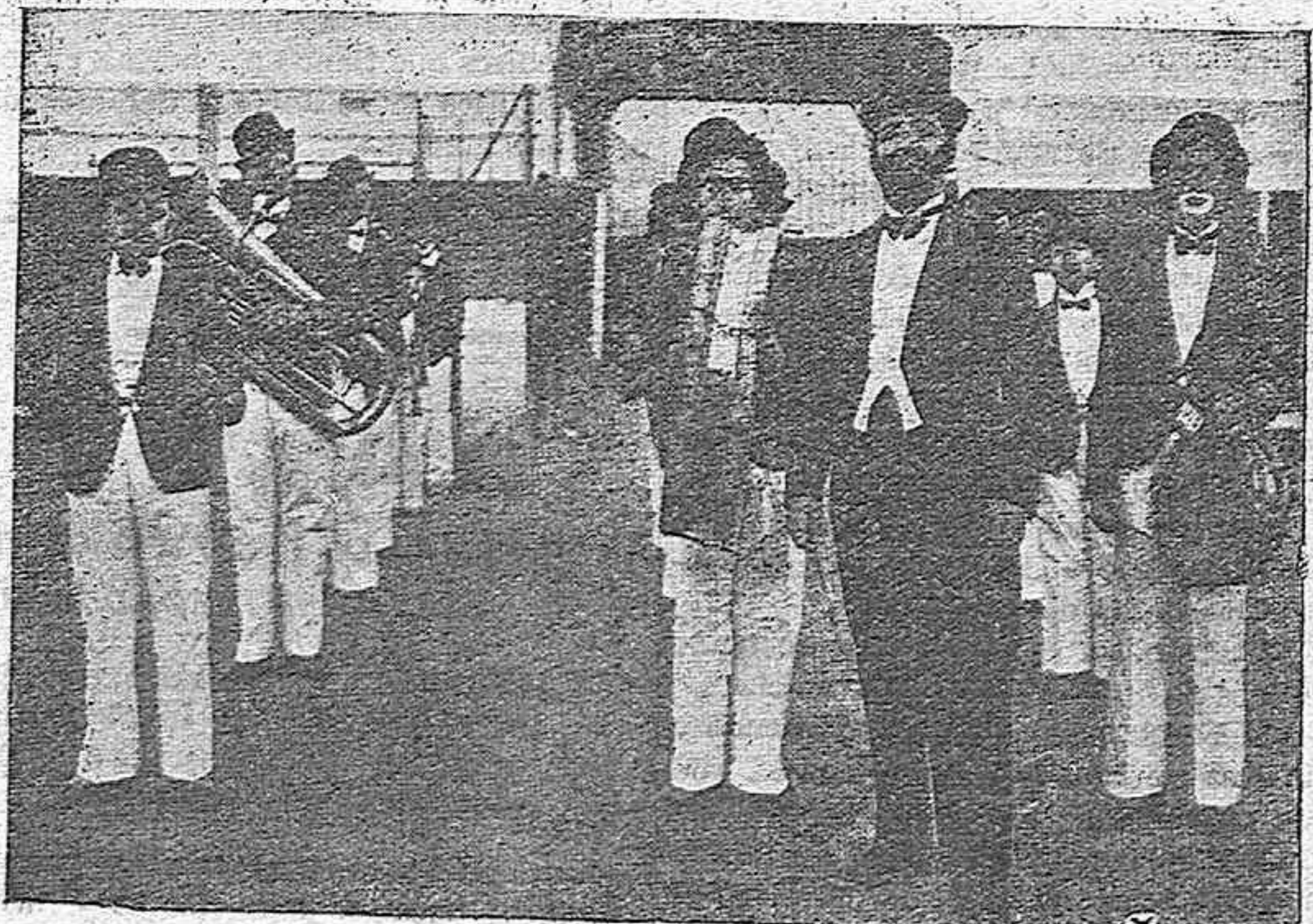
La notable agrupación musical-taurina LA MEZQUITA que en la corrida nocturna del sábado próximo debutará en nuestra Plaza de Toros.

A PRECIOS DE GANGA: cortes de traje para caballero, a 12, 15, 21, 24, 27, 30, 36, 39, 42, 45, 50 y 60 pesetas en EL METRO y sus Tres Sucursales