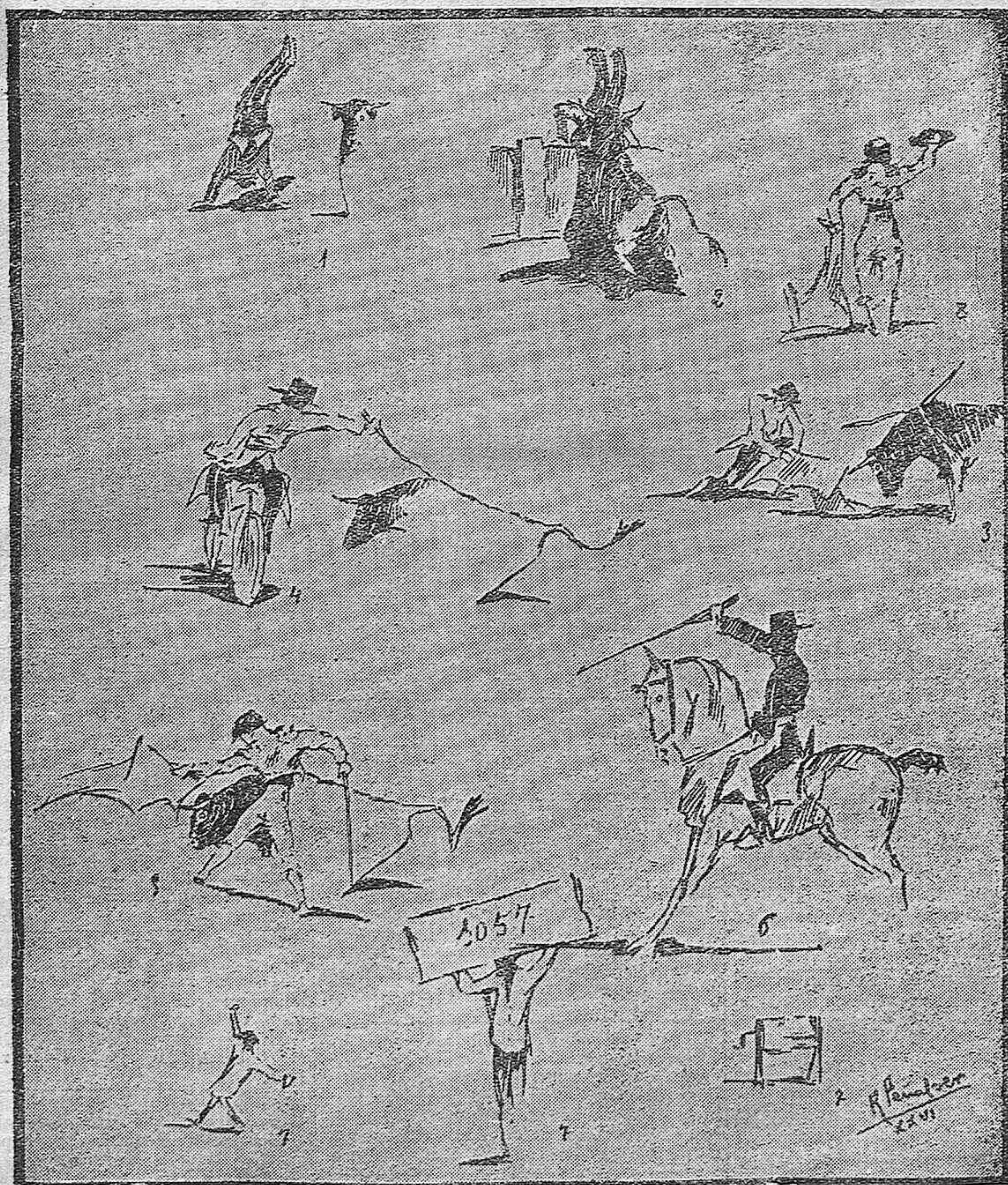
LA ULTIMA NOCTURNA.---1, 2 y 3) El Chispa en varios momentos.--4) Charlot imitando a Cañero en bicicleta.---5) Un natural de Ojeda.---6) La jaca de Florentino.---7) Lo mejor de los toros.---8) Guerrilla recogiendo las únicas ovaciones que se dieron. (Apuntes al natural por Rafael Peñalver.)