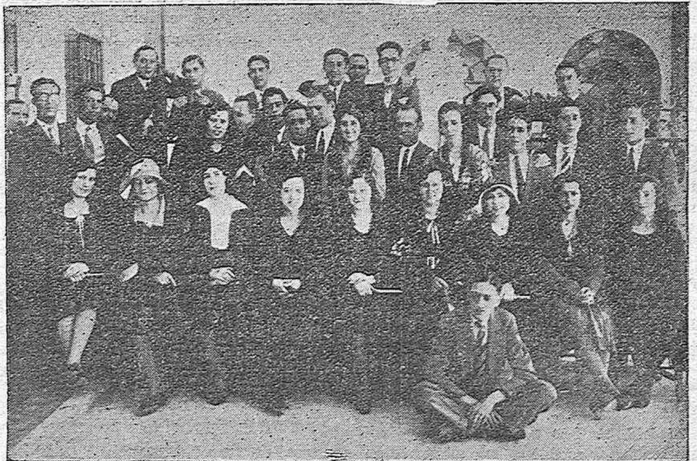
CORDOBA.—Los Maestros opositores de la convocatoria del año 128 que se reunieron en el Centro Republicano para tratar de la organización de la Asociación de enunciada clase, durante la reunión hasta el mediodía tratando asuntos de verdadero interés.

El acto dará principio a las diez de la mañana.