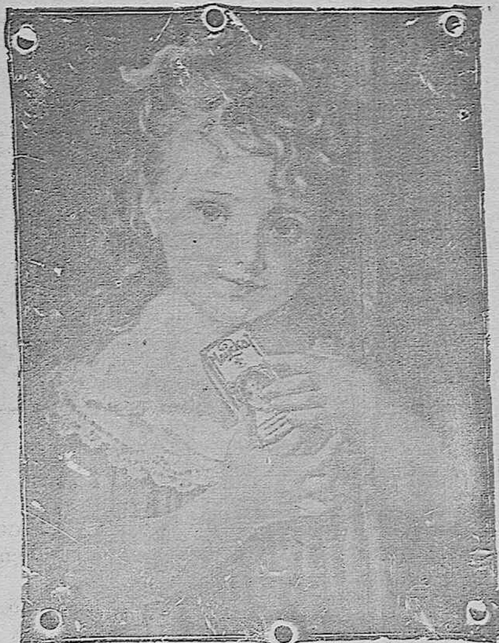
“La niña del Maizkaí”