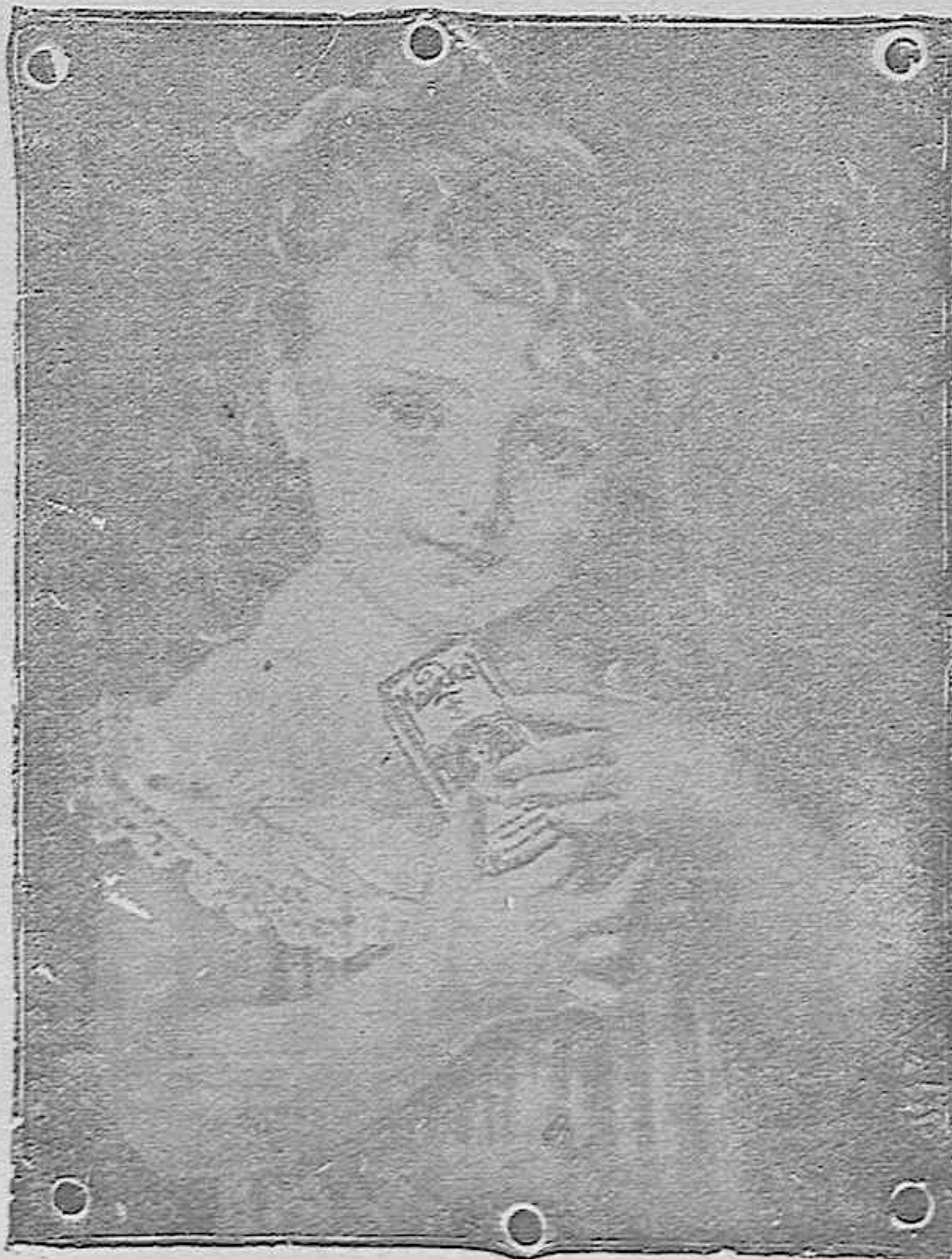
“La niña del Maizkal”

y aniversarios y anuncios de Misas se admiten en la Administración de este periódico, San Pablo, 55, hasta altas horas de la madrugada.