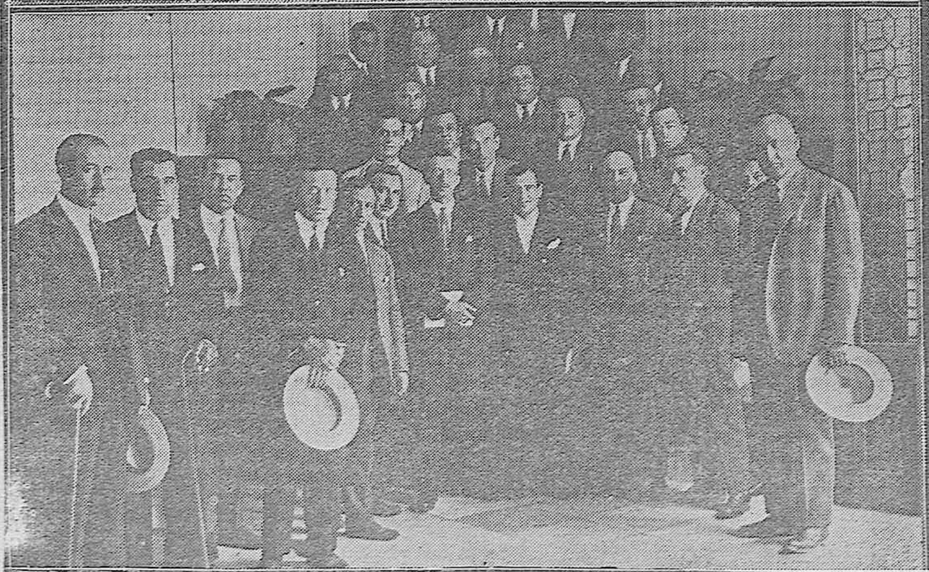
Comisión del Ayuntamiento después de la comida extraordinaria con que fueron obsequiados los acogidos en el asilo Madre de Dios.—El Comité provincial de la Unión Patriótica, rodeados de los alcaldes de la provincia después de la elección celebrada en el Ayuntamiento.