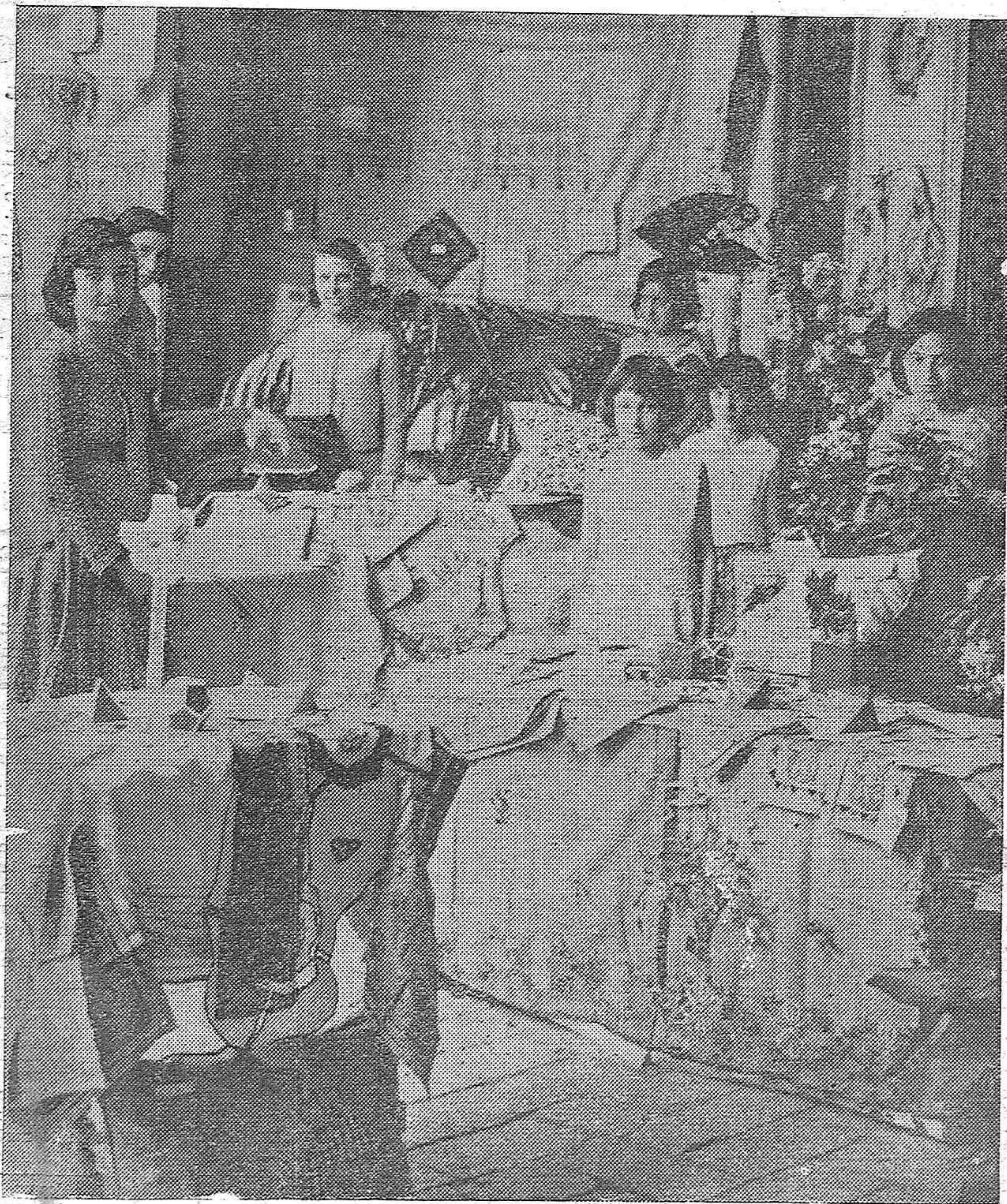
Aspecto parcial de la exposición de trabajos realizados en el curso que ha finalizado por las niñas de la Escuela Práctica graduada que dirige doña Rosario del Riego de Font.