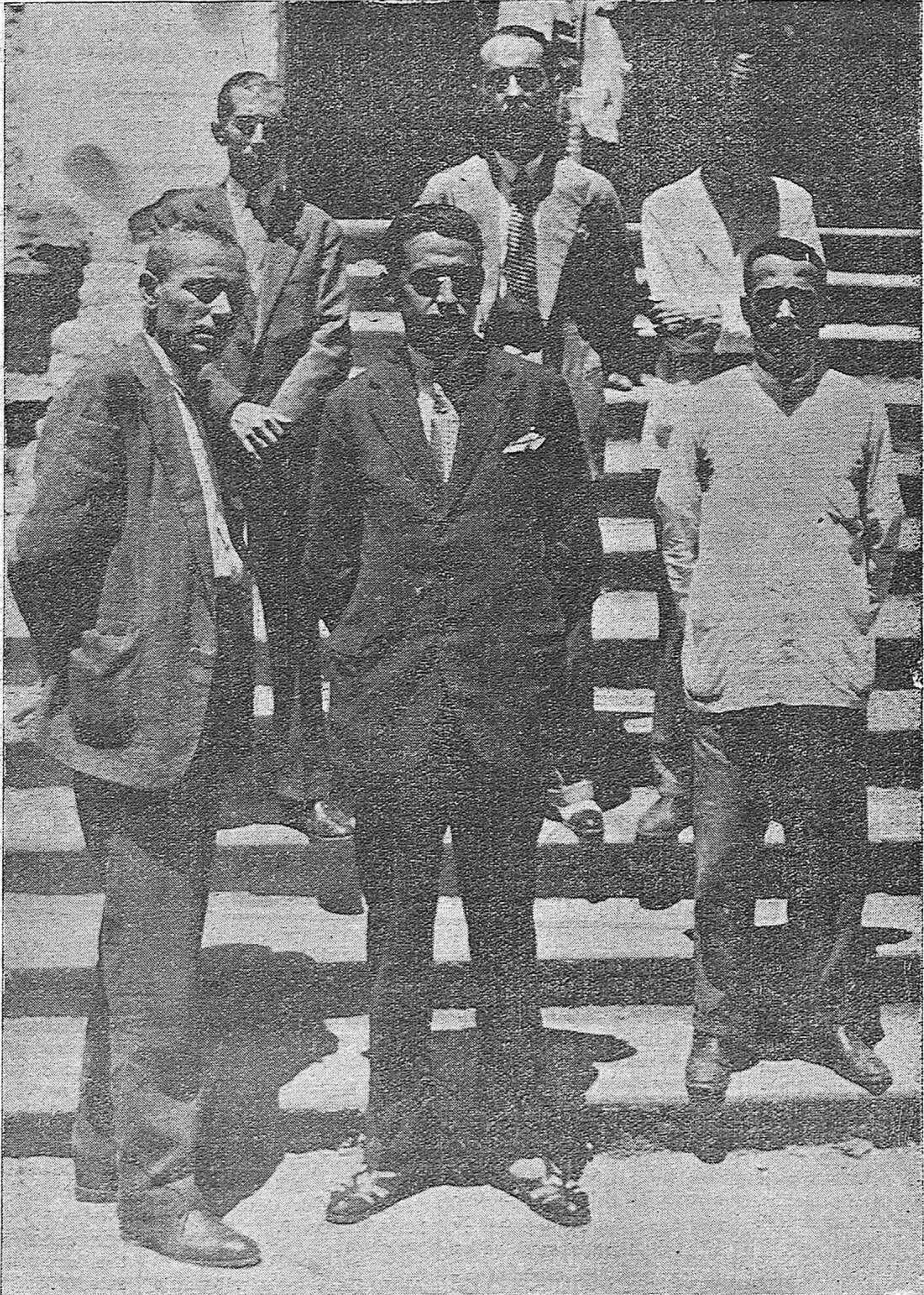
LOS CONFLICTOS SOCIALES EN CORDOBA.—Representantes obreros que visitaron hoy al Gobernador civil para recabar su intervención en los conflictos planteados