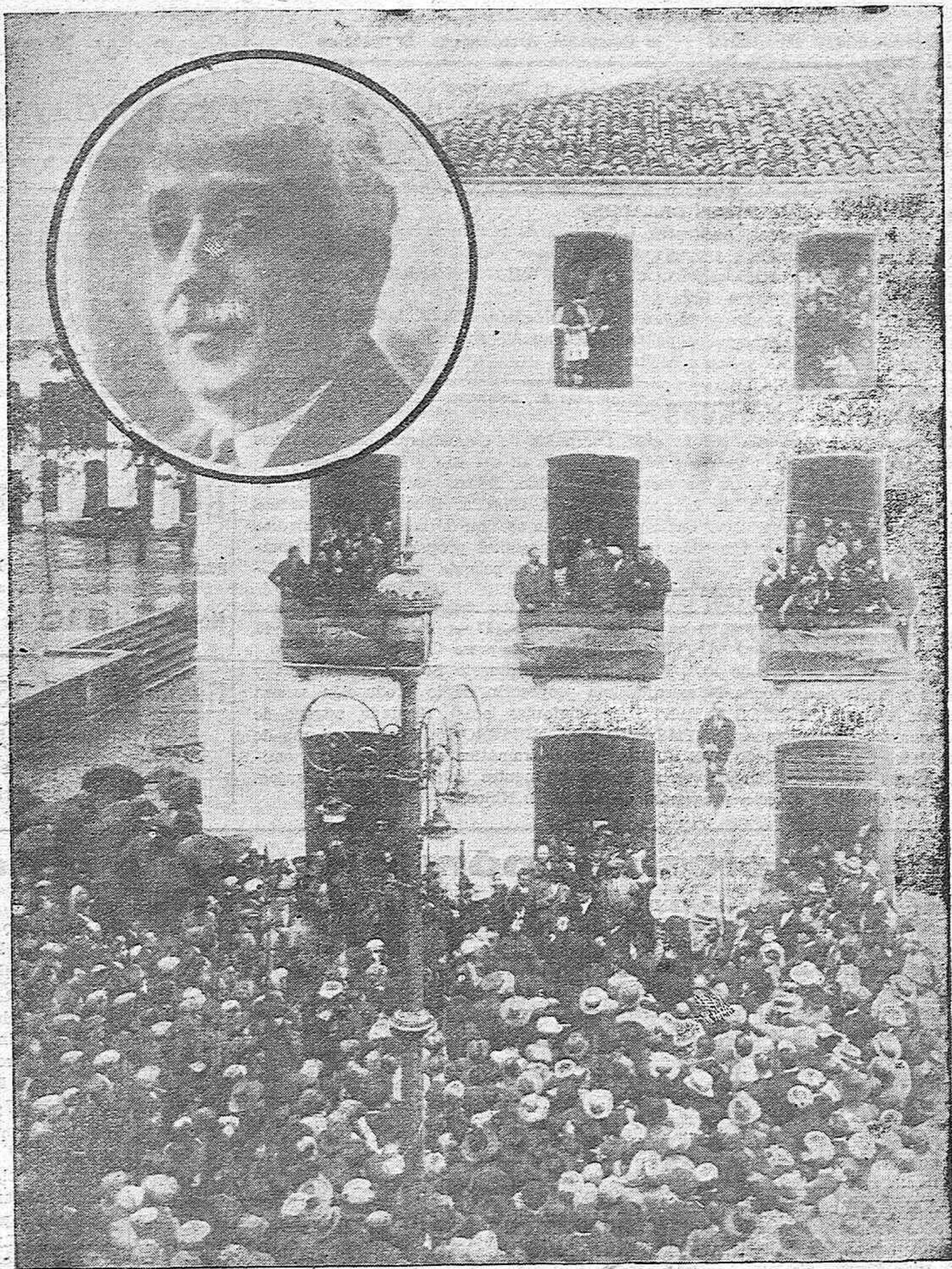
PRIEGO DE CORDOBA.—El ilustre ex presidente de la Republica, pronunciando un elocuente discurso ante sus paisanos