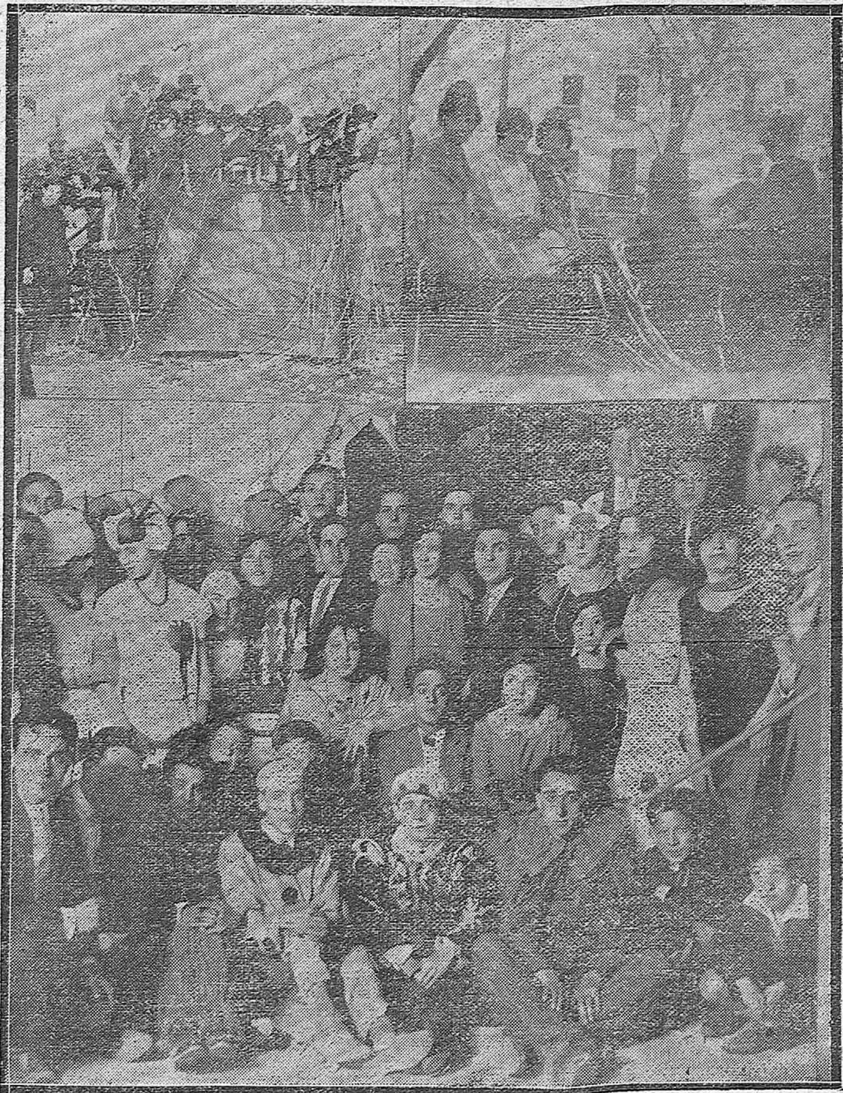
NOTAS DE CARNAVAL.—La carroza «Viva Córdoba» ocupada por distinguidas señoritas.— Tres bellas concurrentes al paseo de la Victoria.— Grupo de concurrentes a uno de los animados bailes que han celebrado las distintas sociedades recreativas de esta capital.