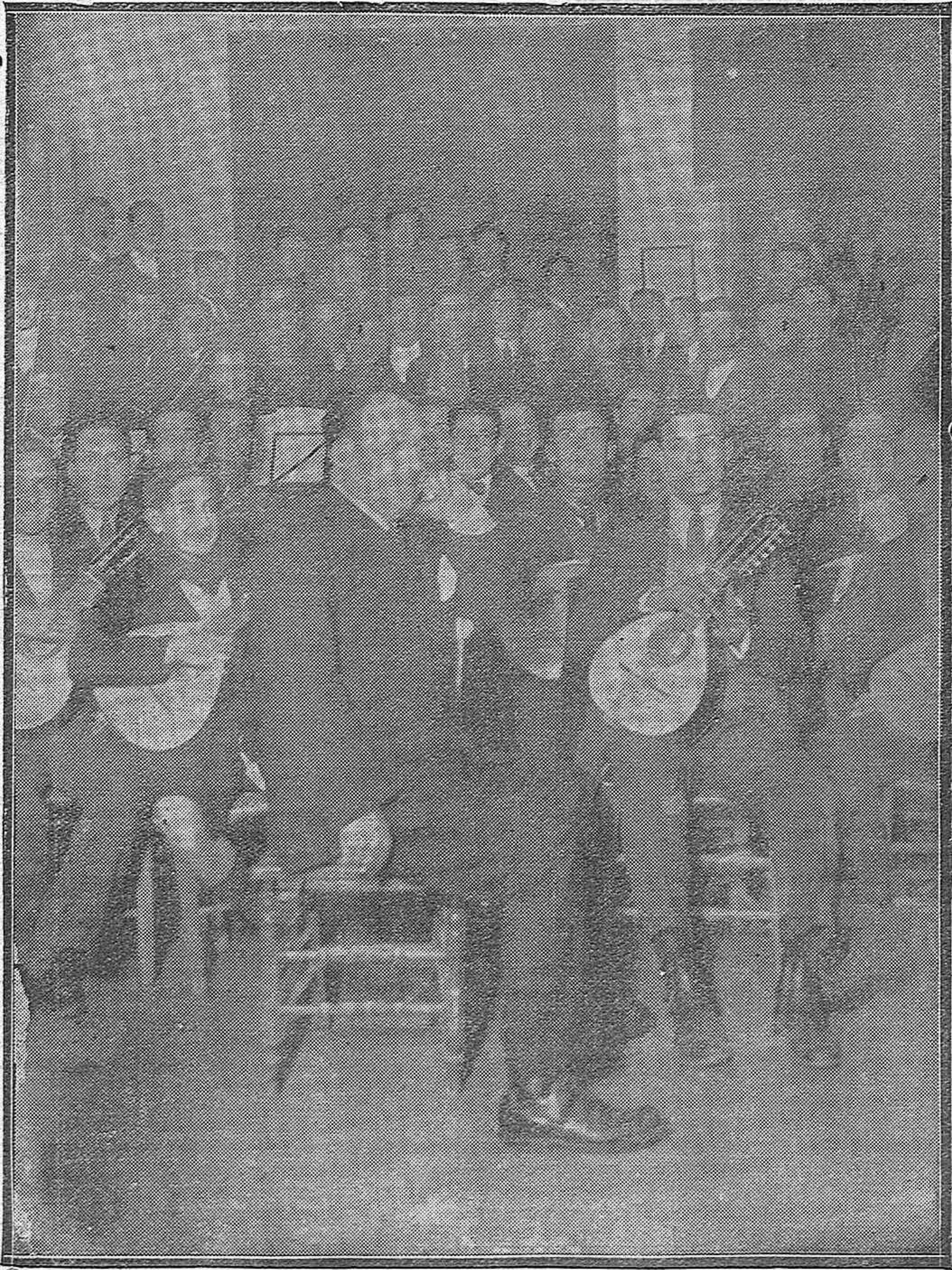
EN EL REAL CENTRO FILARMÓNICO DE EDUARDO LUCENA.—Uno de los últimos ensayos que se están celebrando con motivo de la próxima excursión artística a Cádiz en los días de Carnaval.