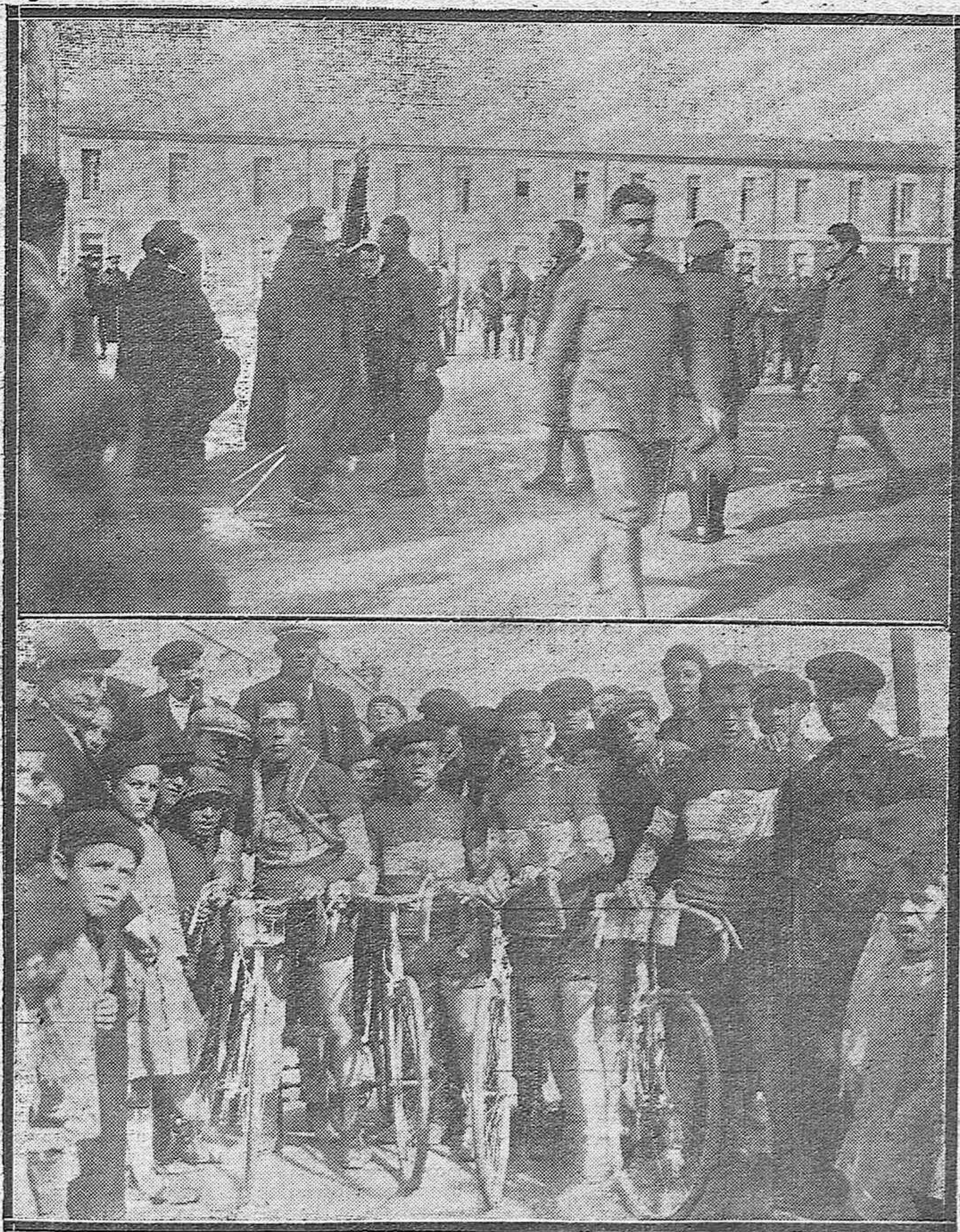
Detalle de la jura de la Bandera por los reclutas del Regimiento de la Reina.—Los cuatro corredores que ganaron los premios de la carrera Córdoba-Carpio y regreso, organizada por la Unión Velocipédica Cordobesa.