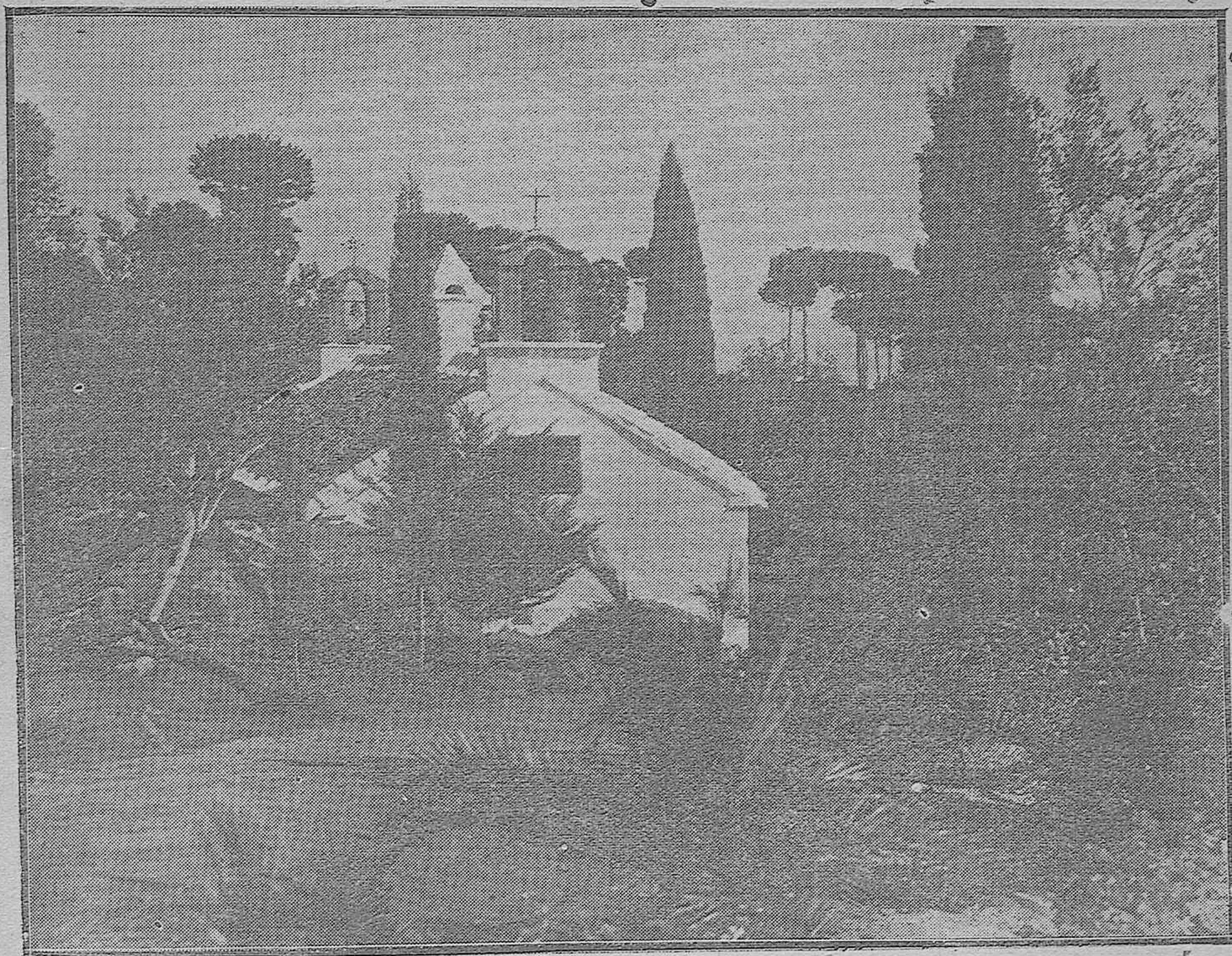
Una interesante vista de las célebres Ermitas de los anacoretas en la incomparable Sierra de Córdoba