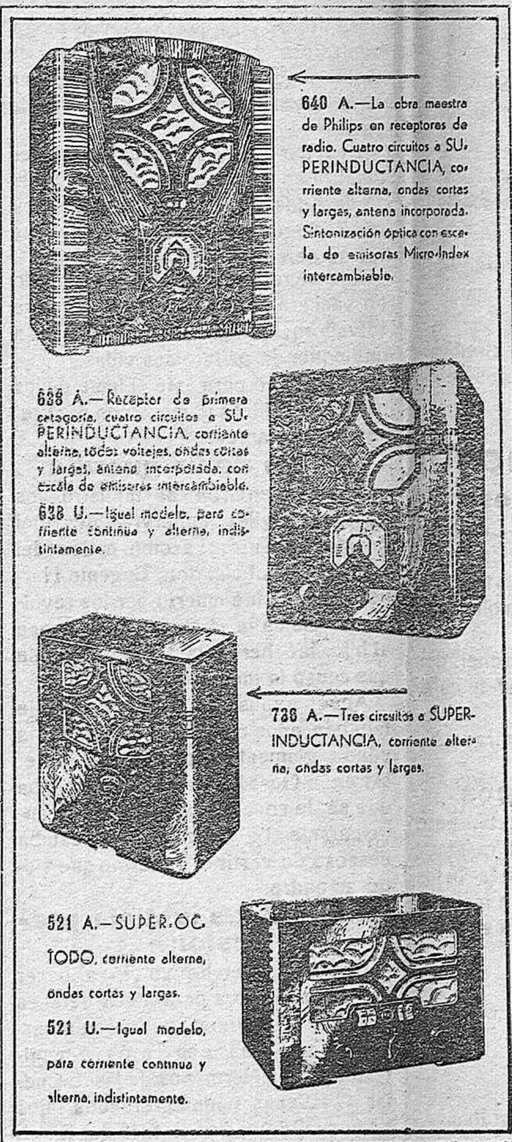
640 A.—La obra maestra de Philips en receptores de radio. Cuatro circuitos a S.U. PERINDUCTANCIA, corriente alterna, ondas cortas y largas, antena incorporada. Sintonización óptica con escala de emisores intercambiable.