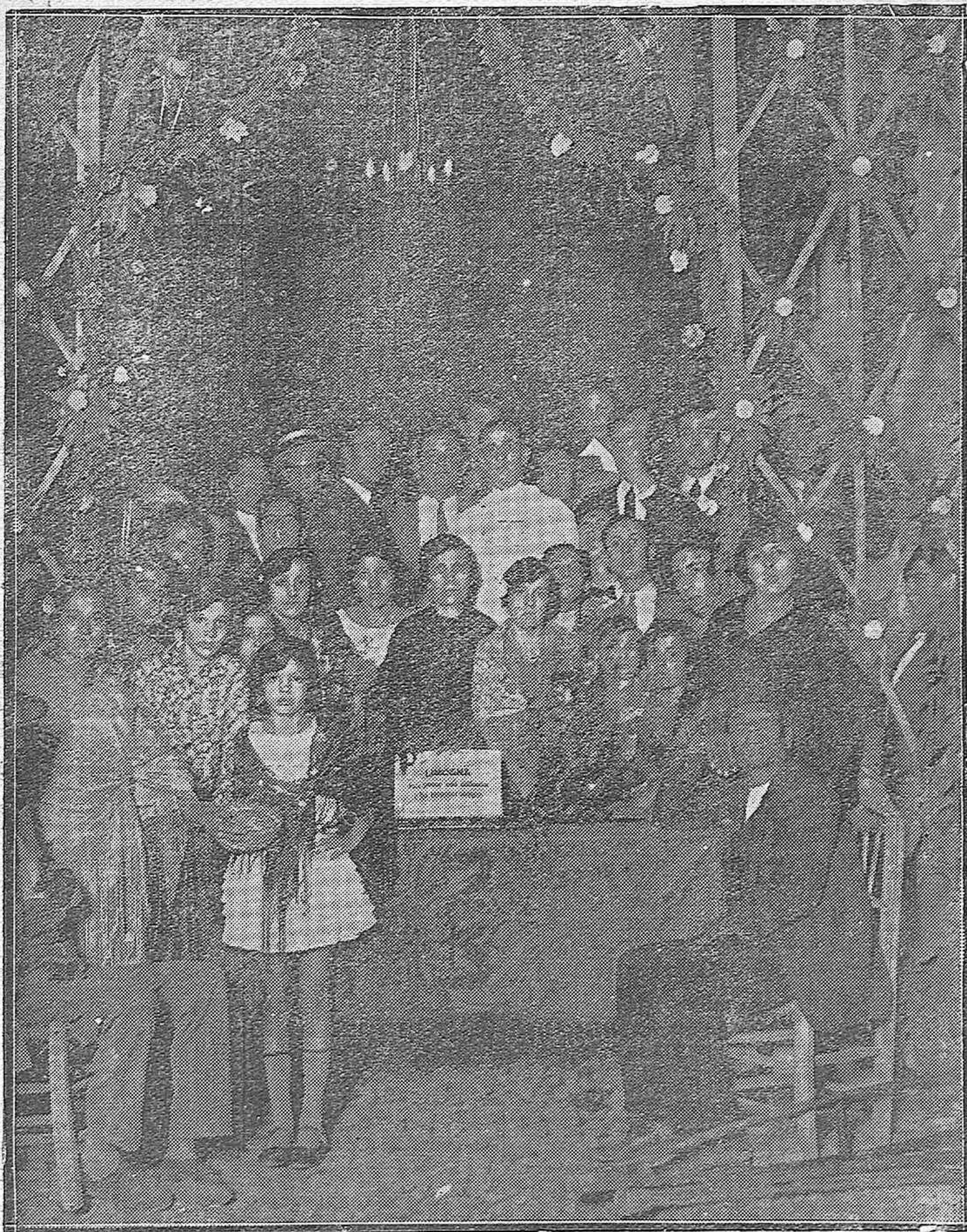
FIESTA BENÉFICA.—Jóvenes que presidieron la mesa en el festival a favor de los inválidos cordobeses que se celebró en uno de los patios de la Plaza de San Pedro.