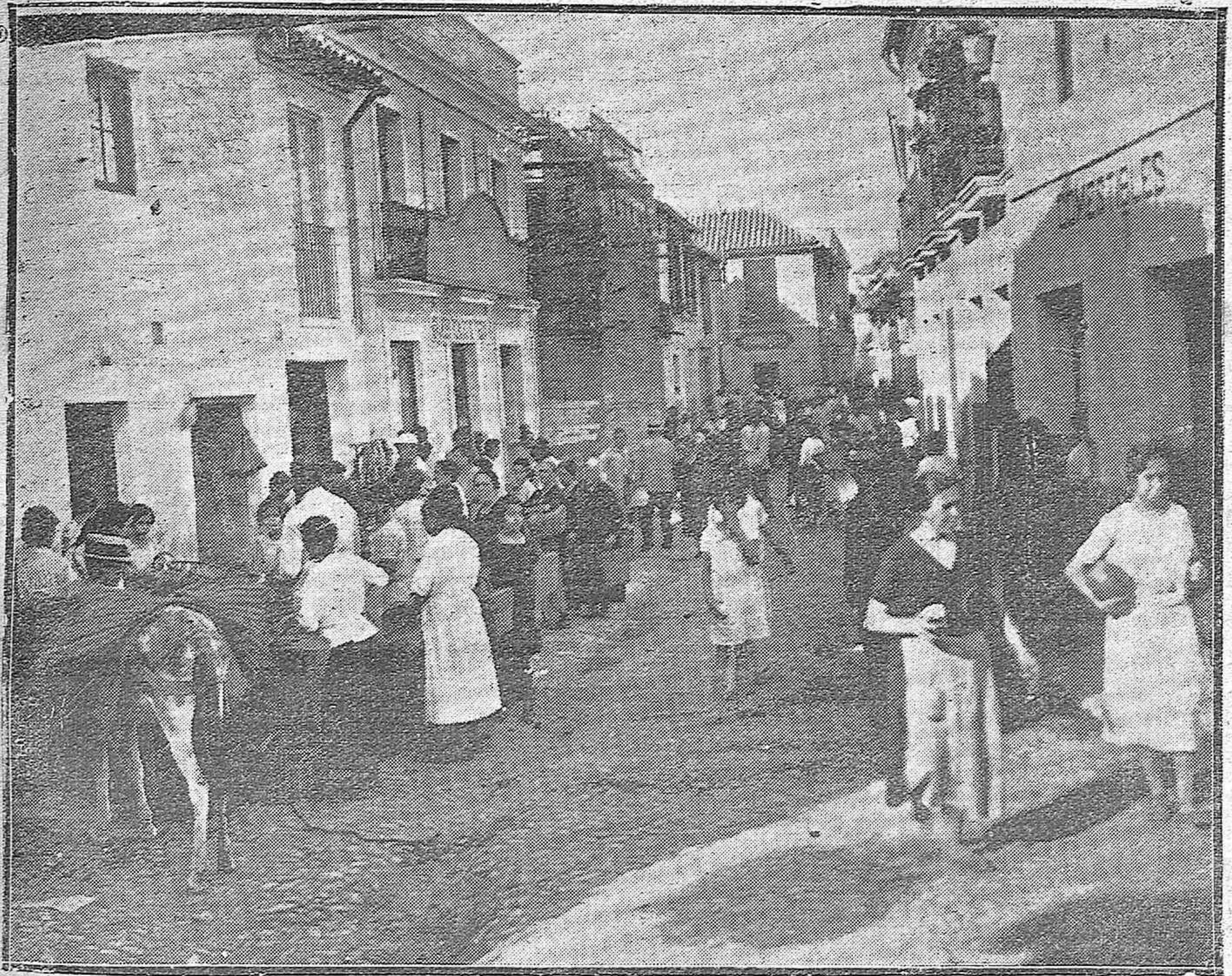
El mercado de San Agustín.-La bulliciosa algarabía del mercado en estas alegres mañanas de sol, adquiere tonalidades pintorescas como un cuadro lleno de luz y de vida.