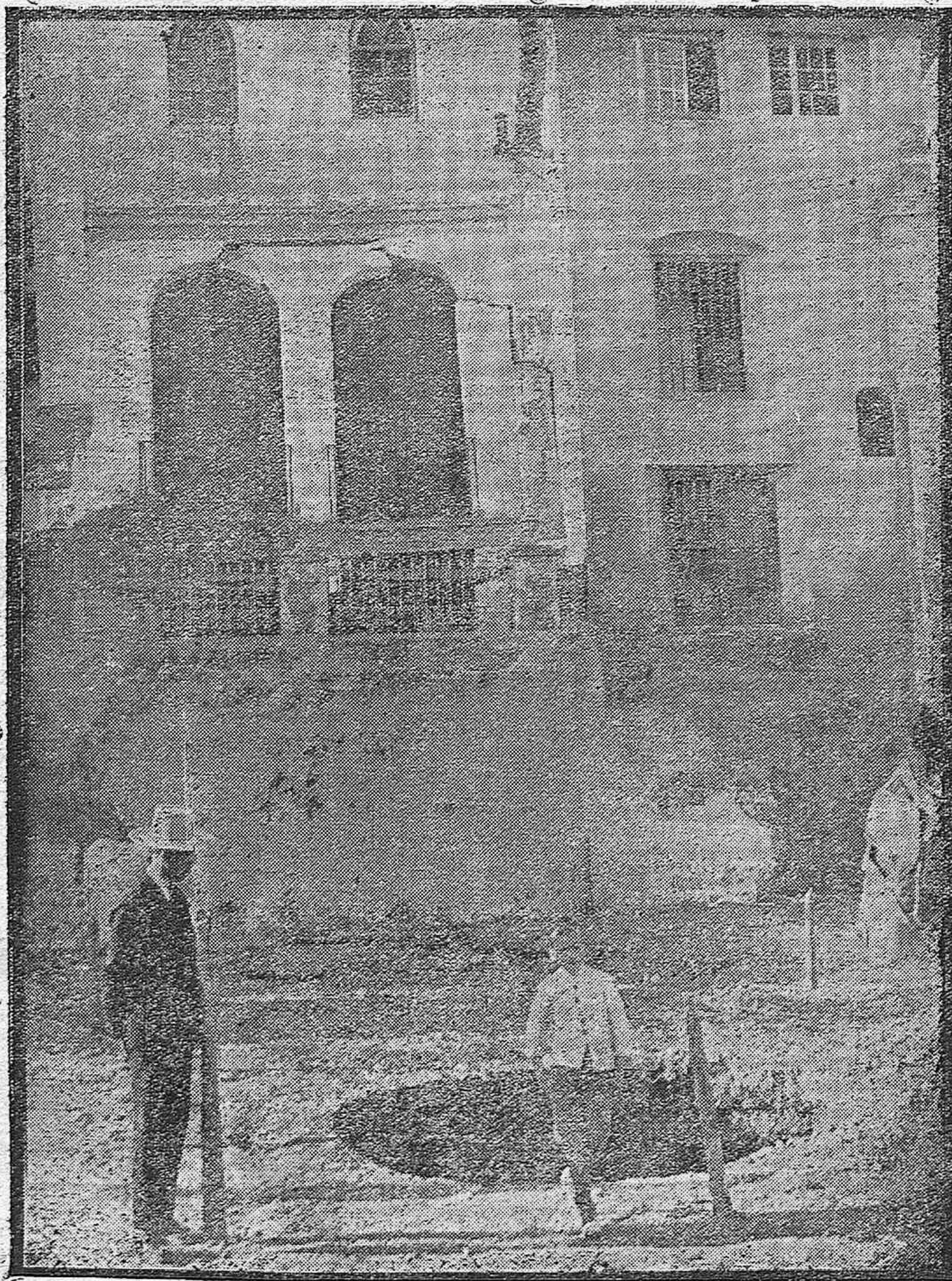
Estado en que ha quedado el despacho rectoral del Seminario de San Pelagio, y hundimientos que se han presentado en el exterior del edificio que mira hacia el río.