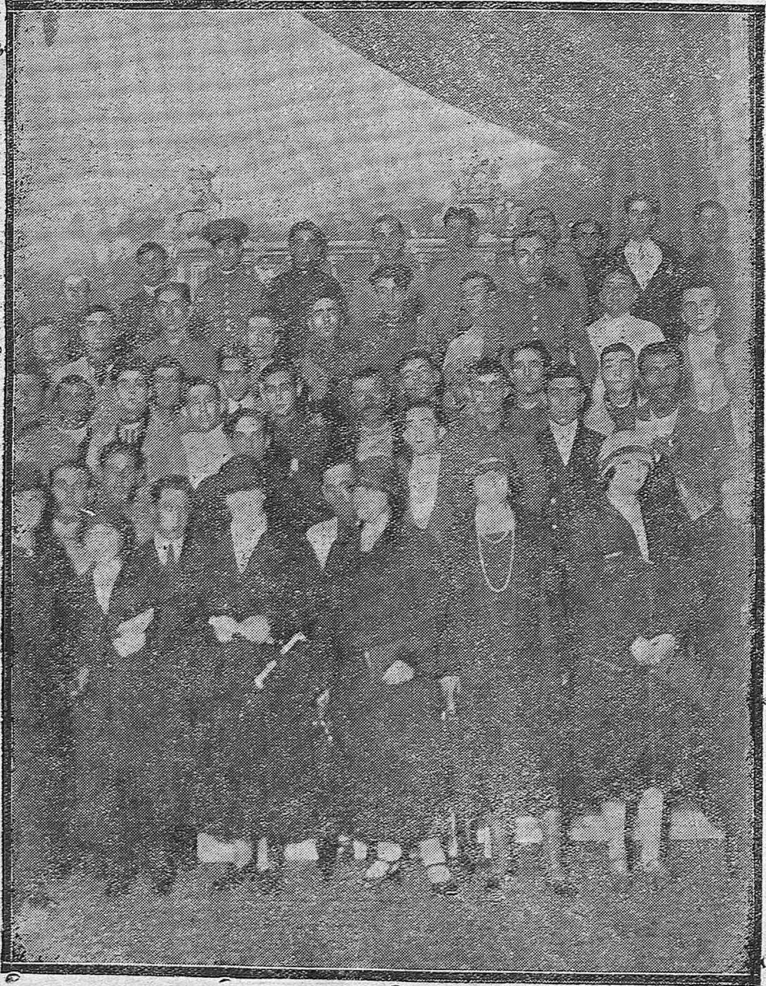
Distinguidas damas catequistas con un grupo de alumnos, en la inauguración de las clases para obreros.