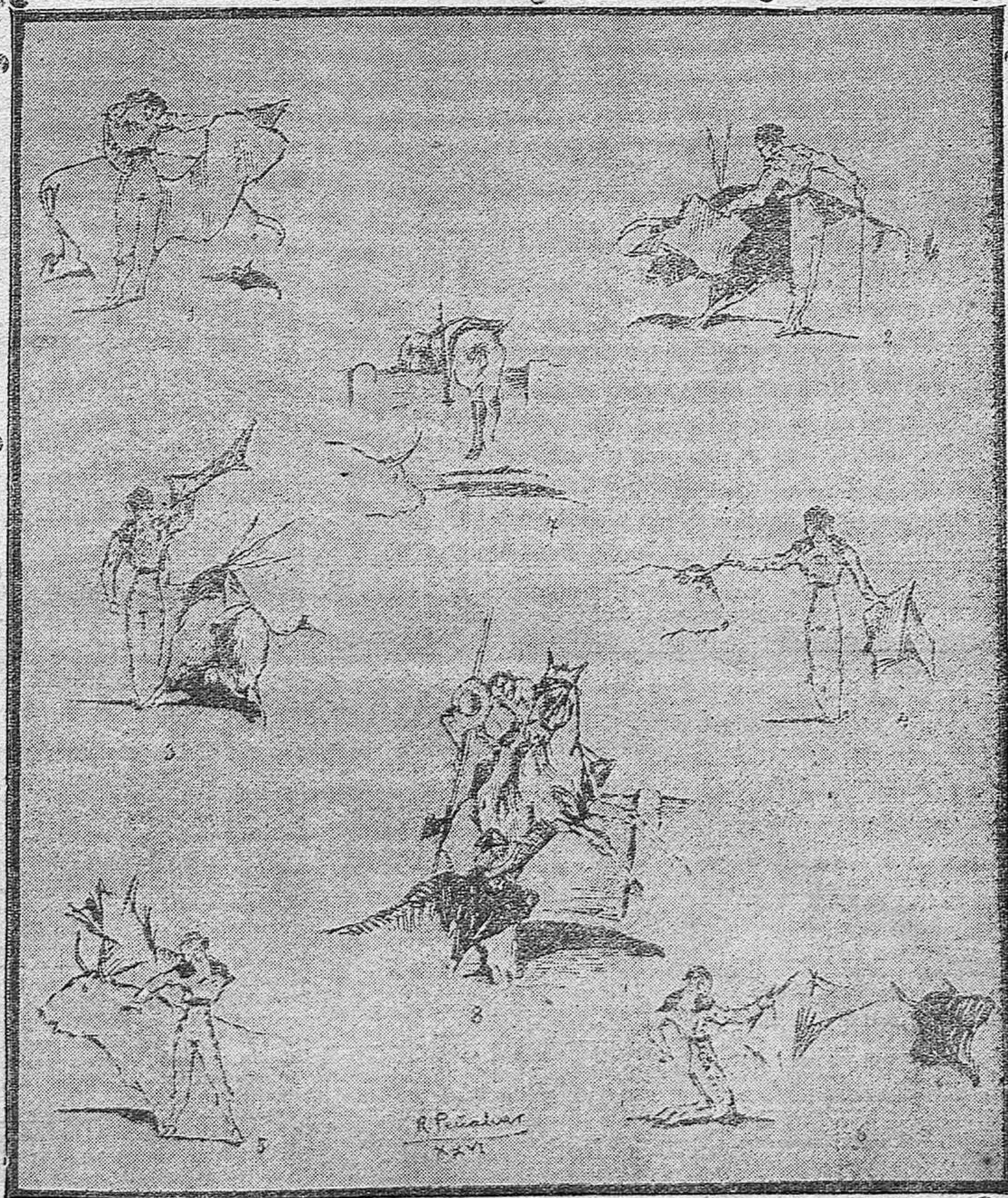
De la novillada de Feria.—1, 2) El Palmeño.—3, 4) Félix Rodríguez.—5, 6) Cantimplas.—7) Un seguridad que perdió la «idem».—8) Una buena vara de Garnago al sexto. (Apuntes tomados del natural por Rafael Peñalver.)