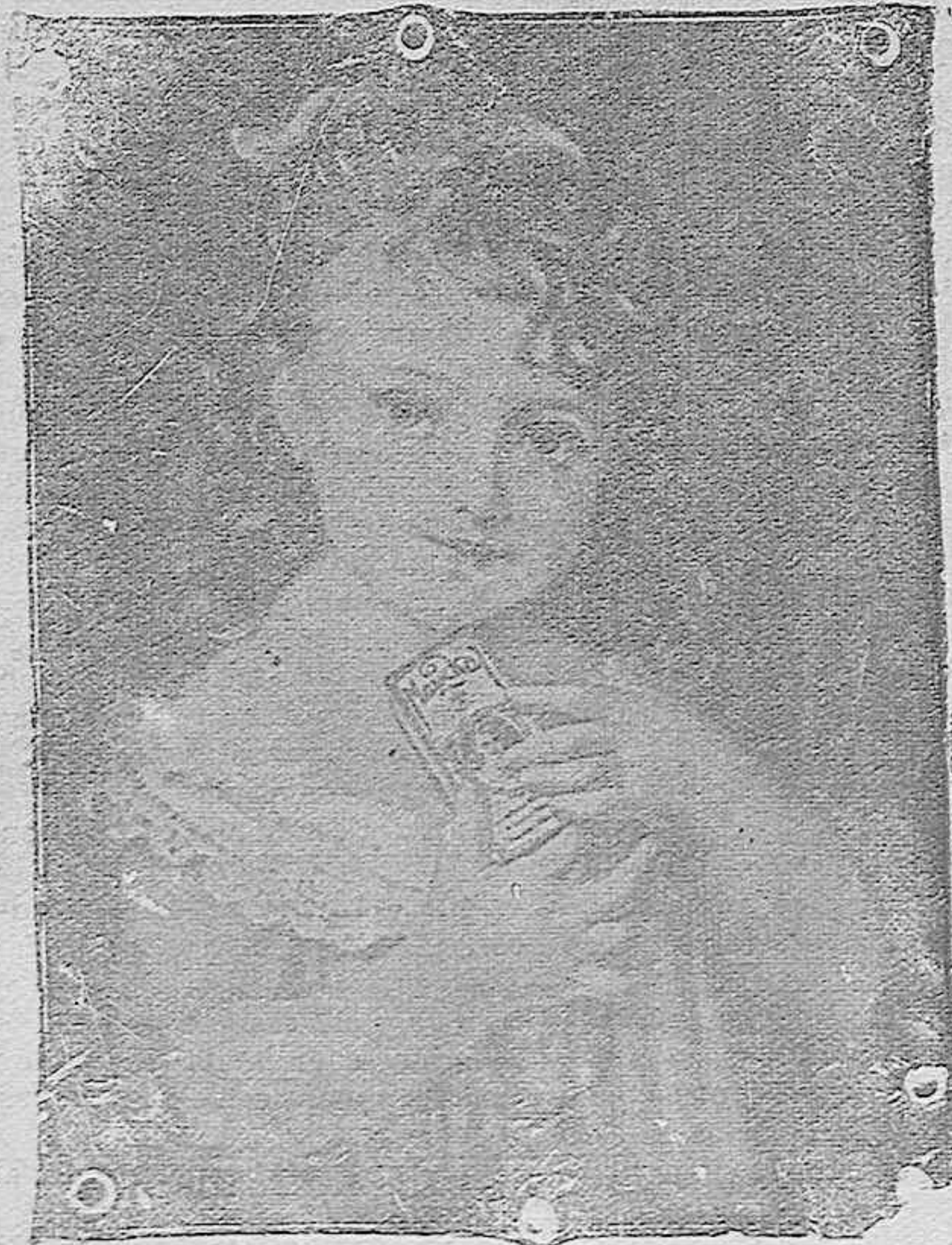
“La niña del Maizkal”

Representantes depositarios de la Compañía Arrendataria de Tabacos.