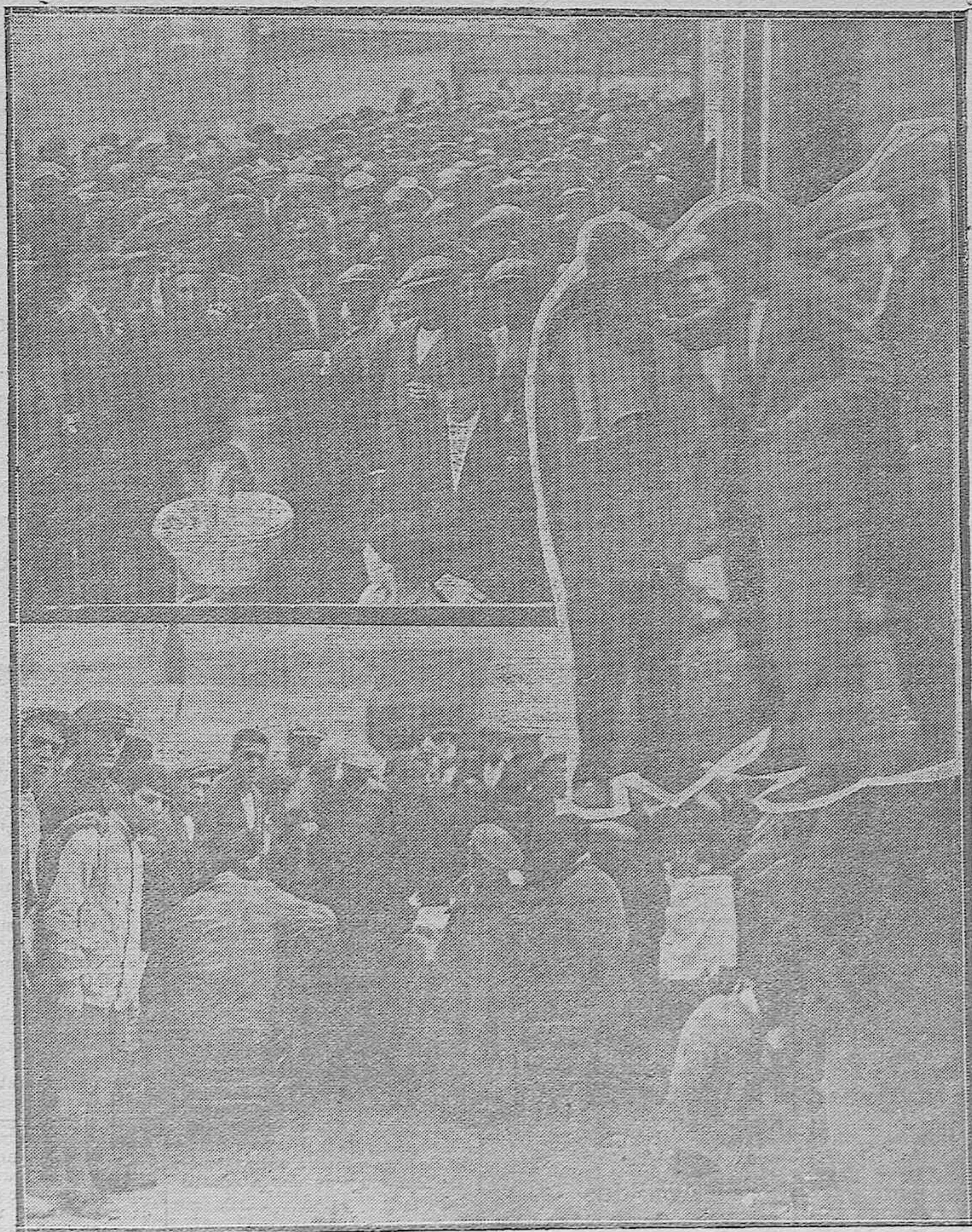
EL SORTEO DE LOS NUEVOS RECLUTAS.—Aspecto de la Zona durante el sorteo verificado el Domingo.—Uno de los cafetines económicos ambulantes durante el sorteo en los alrededores de la Zona.—El padre de un mozo recibiendo la buena noticia de que su hijo le ha tocado para España.