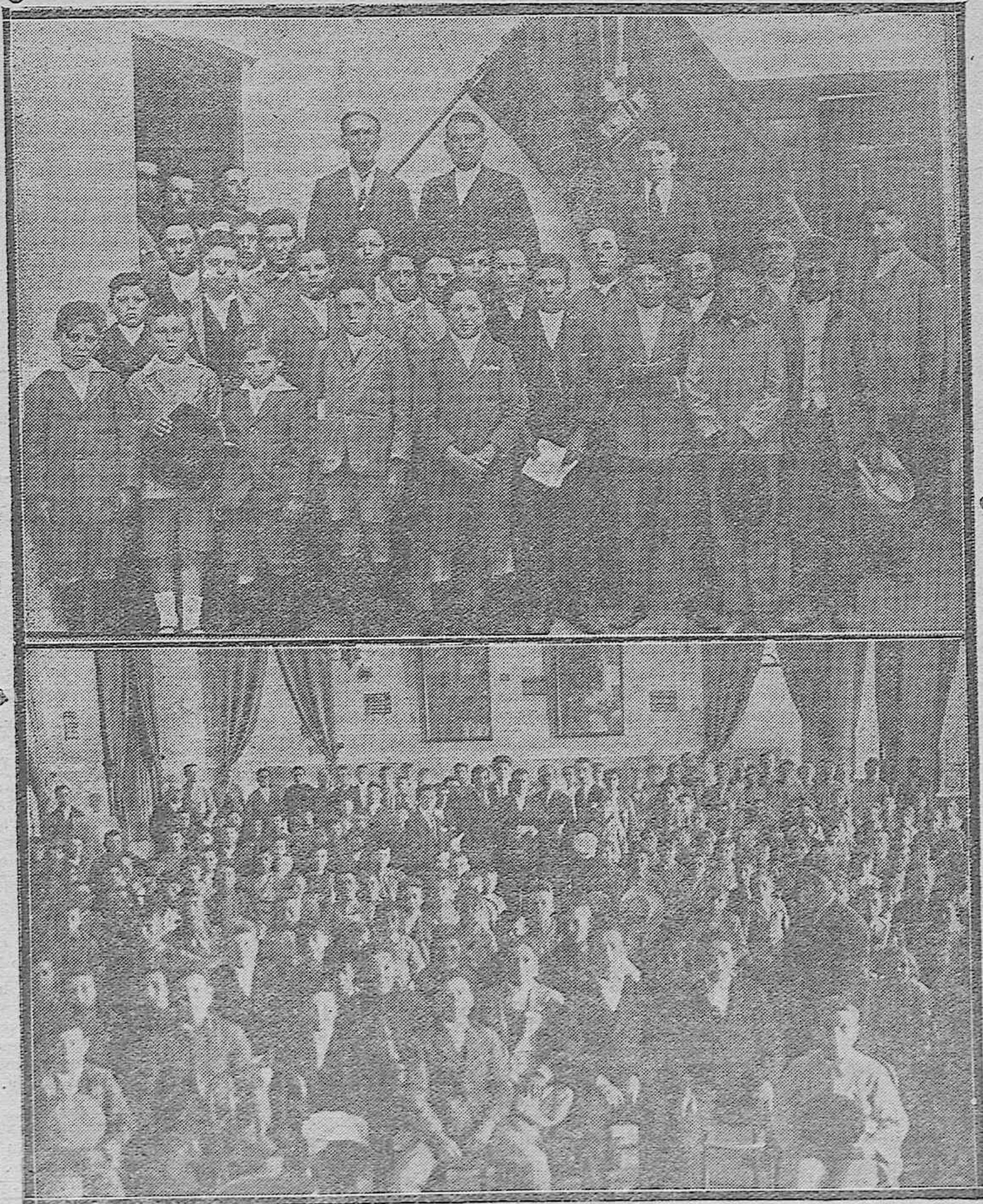
LOS ZAGALES ECIJANOS.--Agrupación cultural educativa que han venido en viaje de estudio como premio a la terminación de la Fiesta del Zagal, que anualmente celebran en Ecija.—Los Zagales con el Profesor y Junta creadora de esta agrupación.