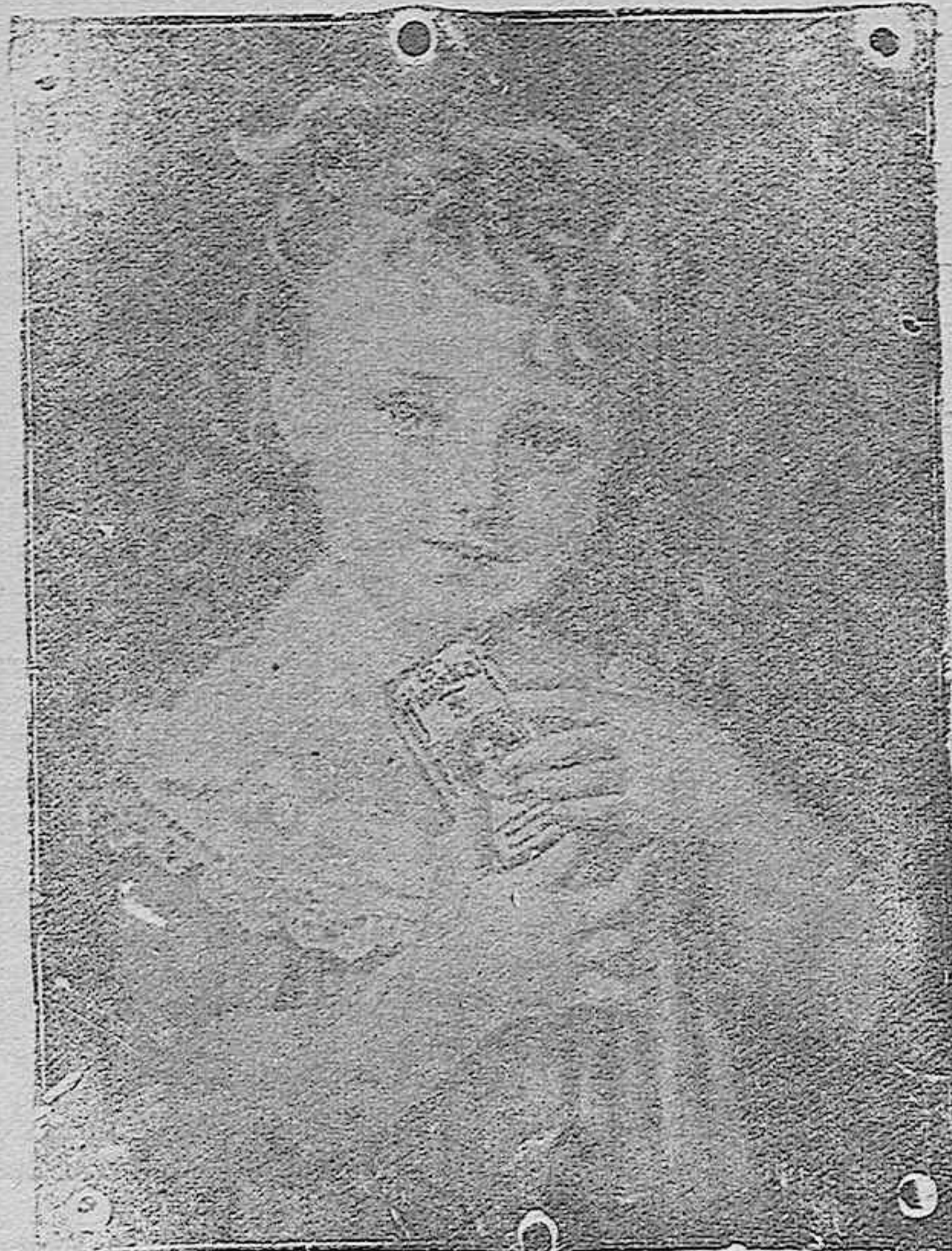
“La niña del Maizkal”