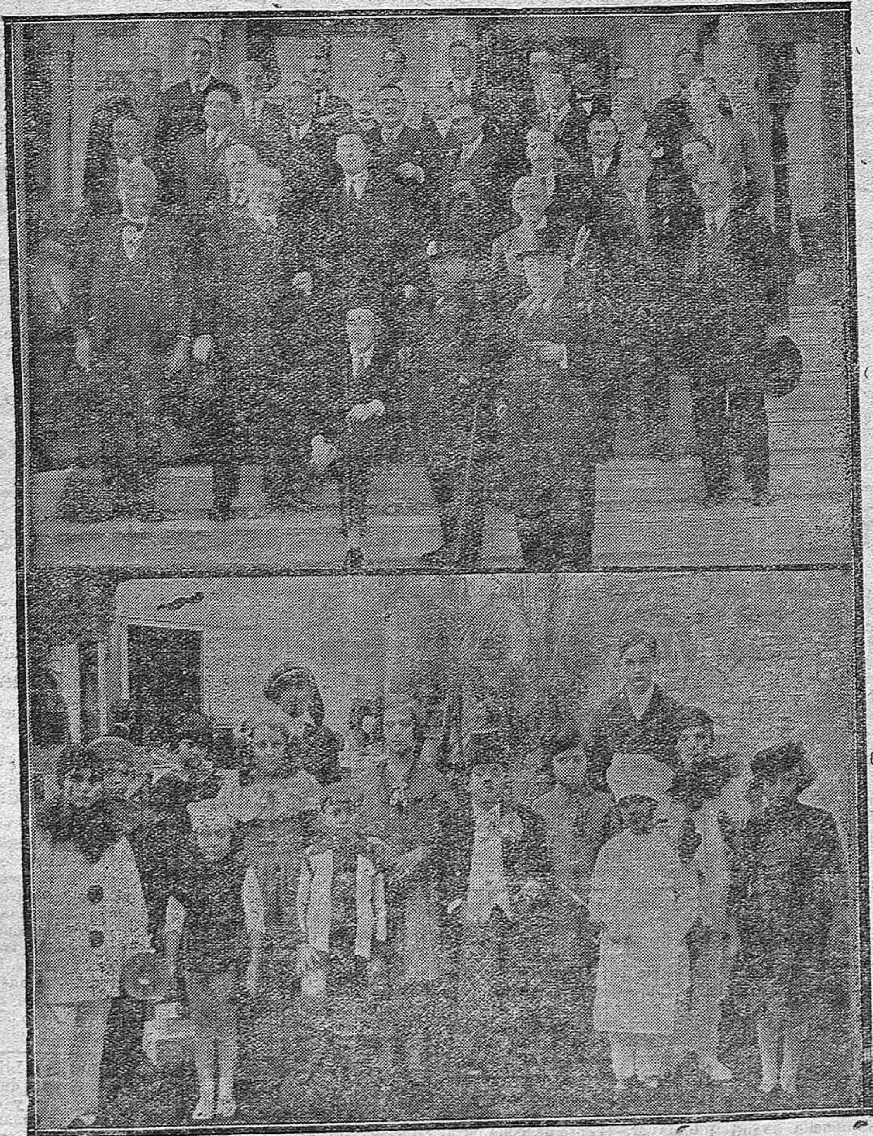
LA FIESTA DEL SECRETARIADO.—Los miembros del Colegio Oficial de Secretarios, al terminar el «perol» con que celebraron en la Huerta de los Arcos, su fiesta anual. FESTIVAL INFANTIL.—Preciosos niños de la buena sociedad cordobesa, que actuaron en el festival celebrado en la calle Valladares a favor de la obra social Católica.