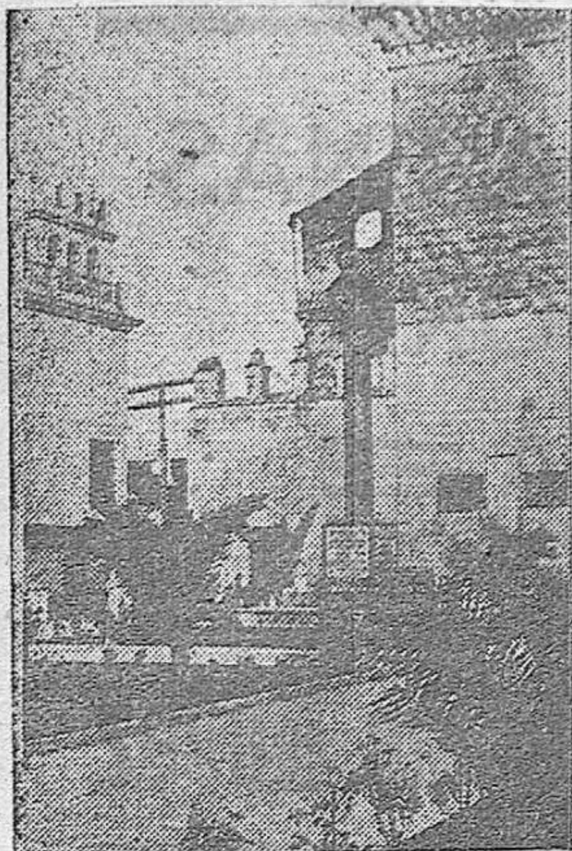
La Cruz de los Caídos de Fernán-Núñez, una de las mejores de España

Este año celebrará con gran éxito su TIPICA FERIA