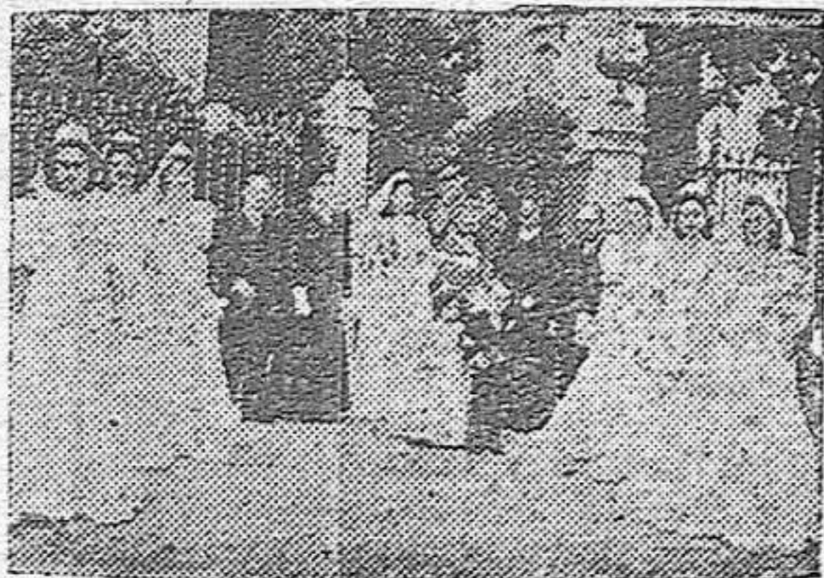
El nuevo matrimonio, acompañado de su corte de honor y de sus familiares, en el jardín del Instituto egabrense, donde se celebró un espléndido banquete.