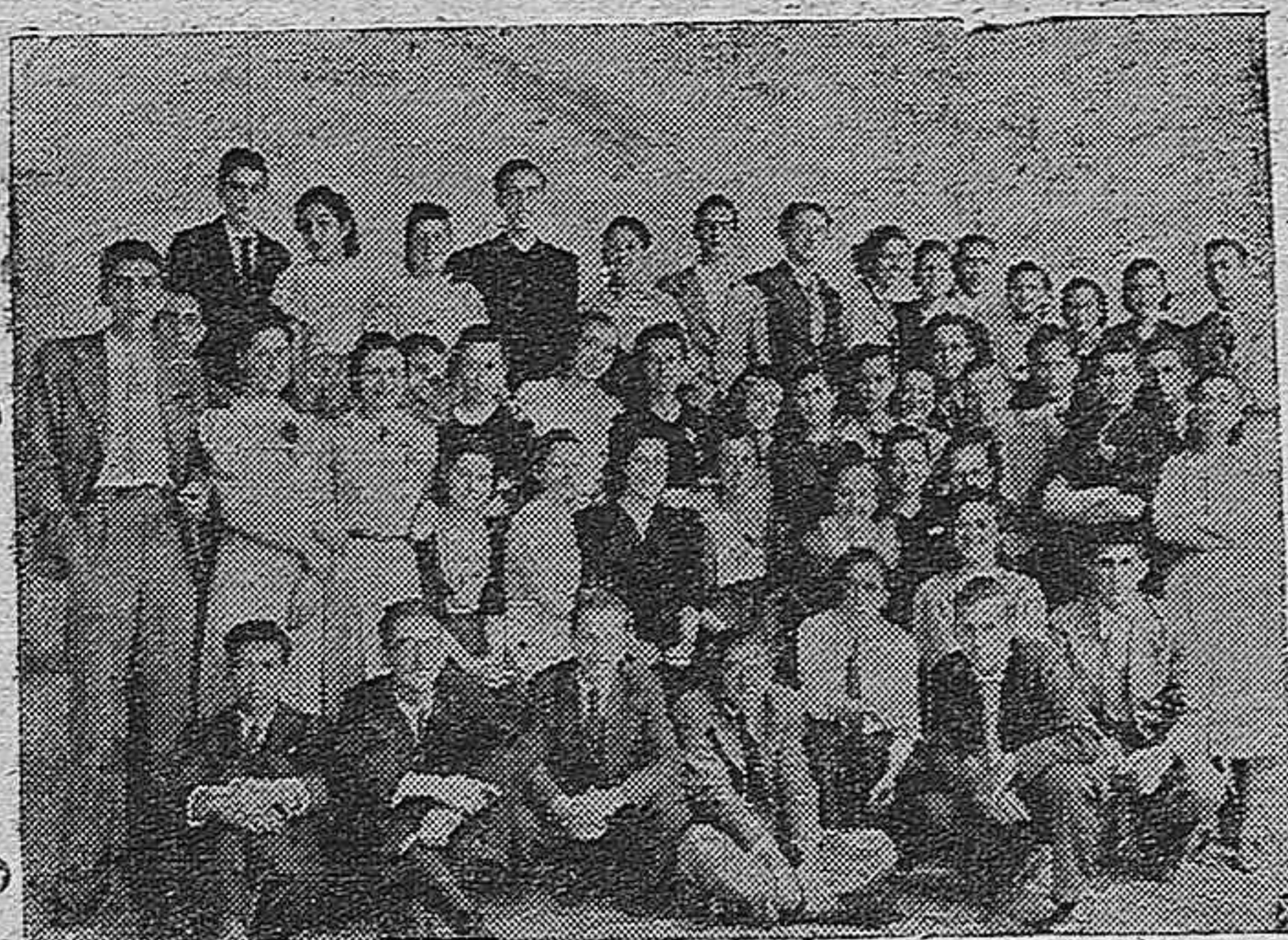
Estudiantes del S. E. U. que han terminado el Bachillerato en el Instituto de Córdoba