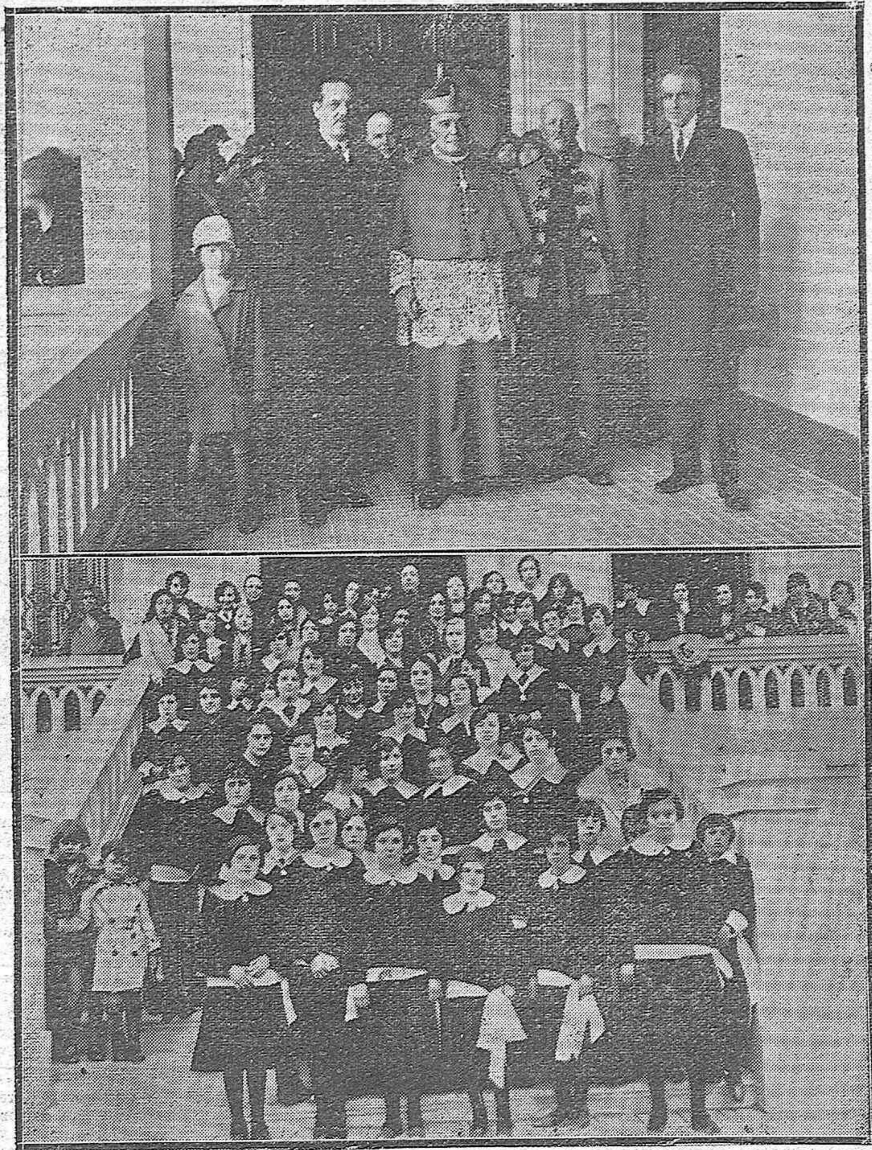
DE LA INAUGURACION DEL COLEGIO SALESIANO.—El Obispo de Córdoba, Alcalde, Presidente de la Diputación y Gobernador militar, en el acto de inauguración.— Brillantísima representación femenina de los Colegios que asistieron.