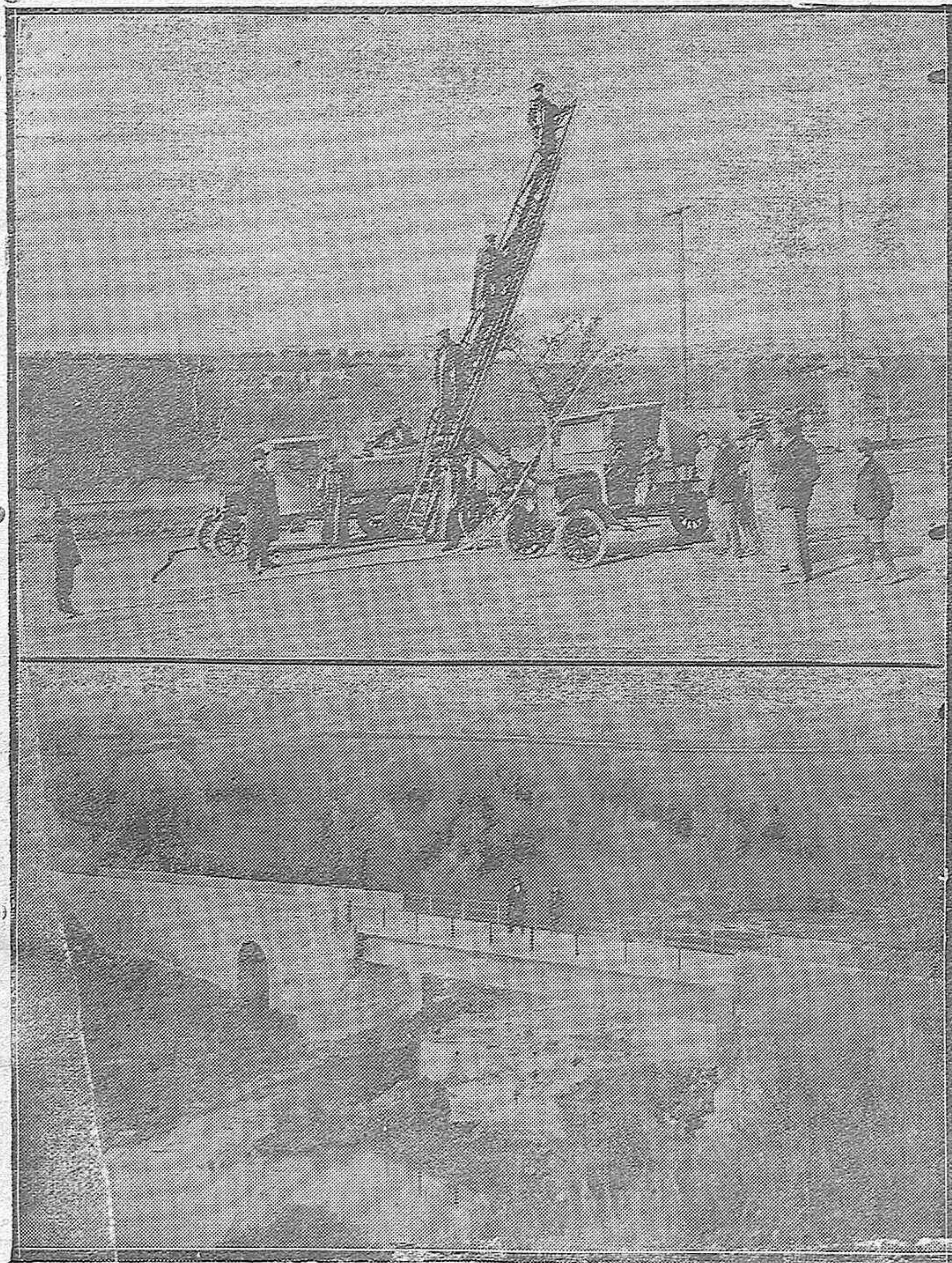
DE LAS MEJORAS DE PUENTE-GENIL.—Prácticas de los bomberos con el excelente servicio de incendios, recientemente establecido.—El puente sobre el río Yeguas, que evitará en lo sucesivo la incomunicación en que quedaba la aldea de Sotogordo a consecuencia de las riadas.