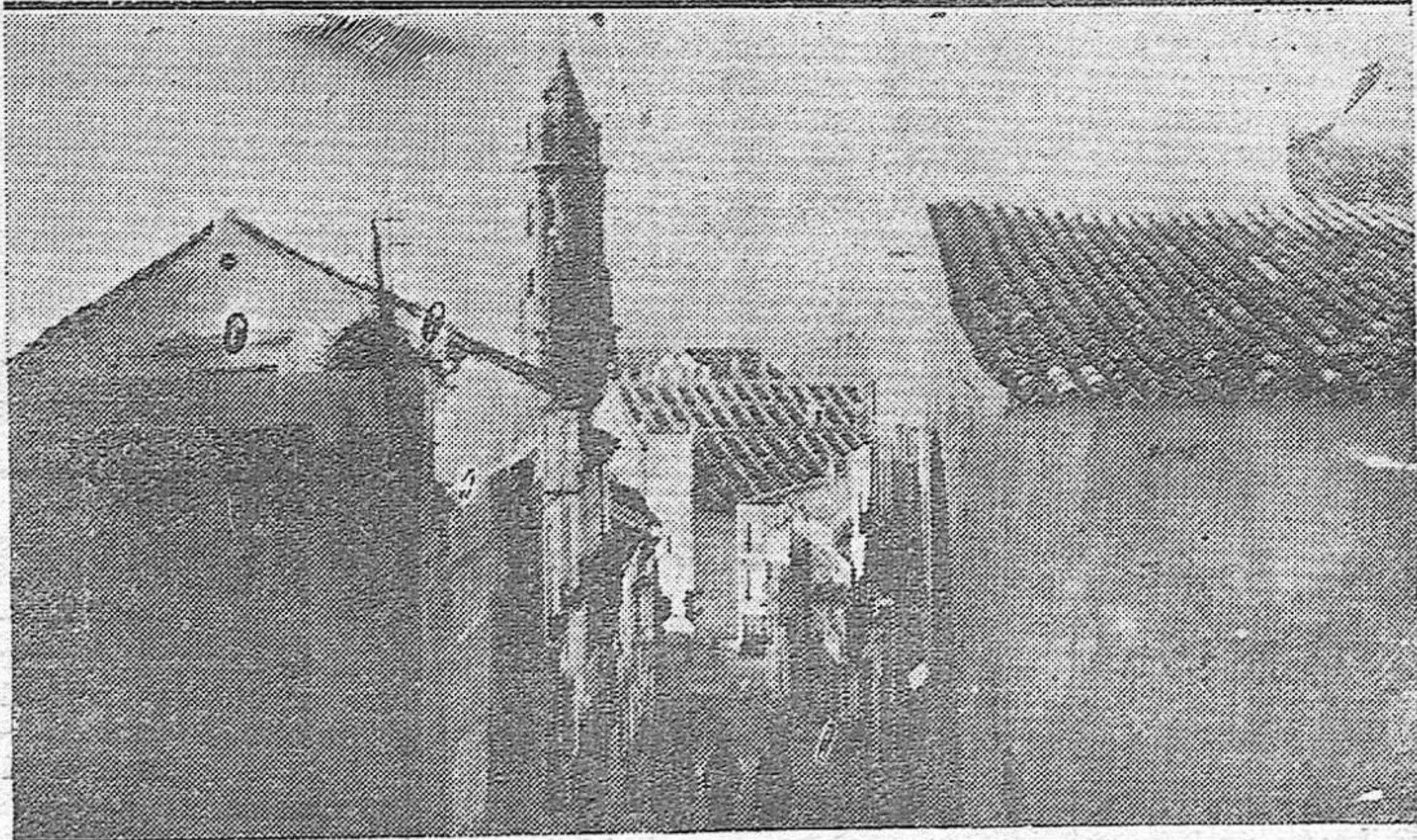
ARRIBA: Uno de los barrios extremos de Antequera después de haber sido tomado por la columna del general Varela.—ABAJO: Calle de Antequera que conduce al histórico castillo y por donde subieron combatiendo heroicamente las fuerzas del Ejército español.