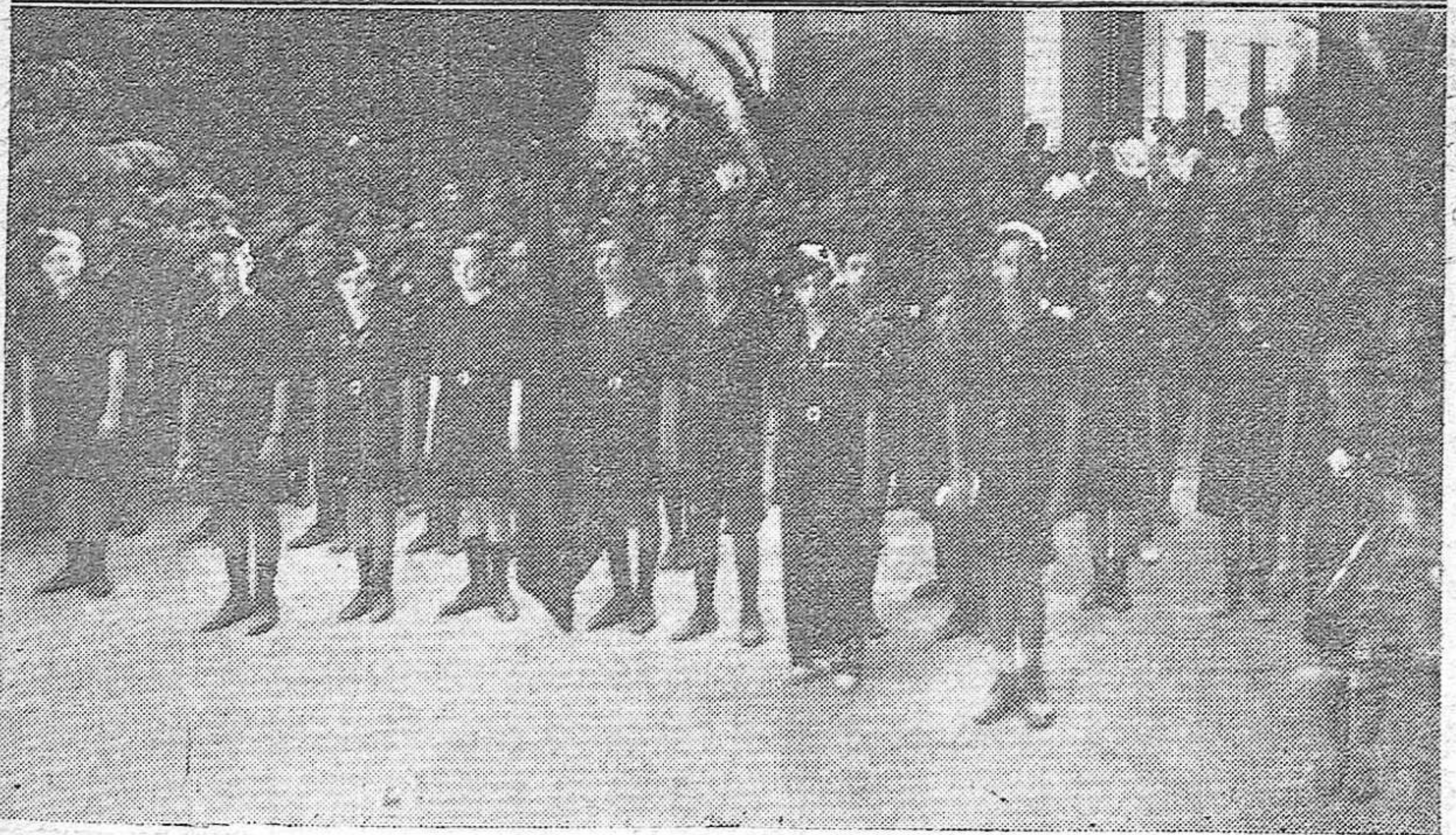
ARRIBA: Llega al aeródromo de Antequera, ocupado por fuerzas del Ejército, un aparato des- pués de operar eficazmente sobre los marxistas, dispersándolos. El heroico aviador es aclamado por las fuerzas al grito de ¡Viva España!—ABAJO: Los "batallas" de Córdoba, forman ante su cuartel, antes de desfilarse por la población.