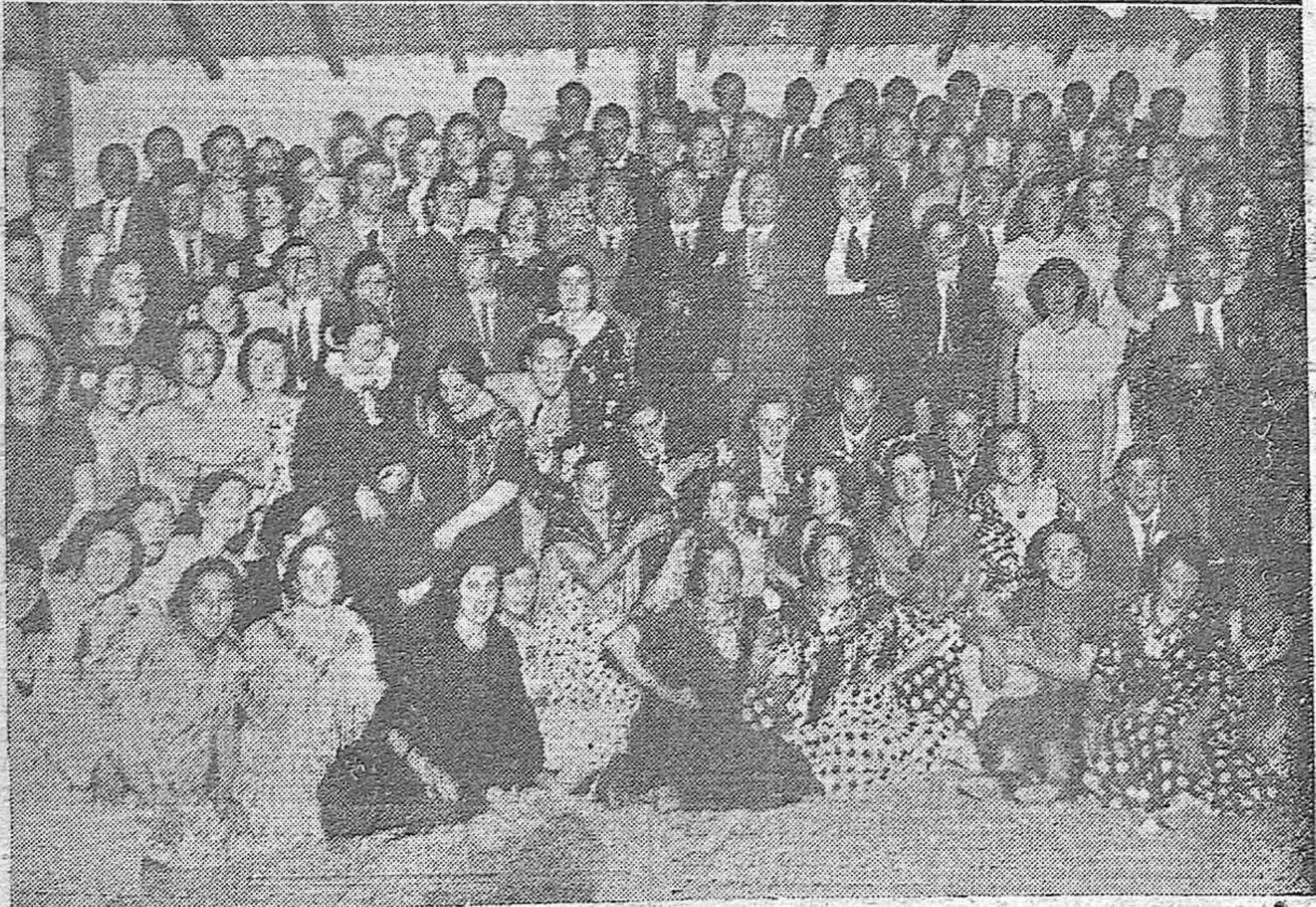
Dos momentos de la verbena celebrada en el Stadium Electromecánica en honor de los EREU- sionistas madrileños de dicha entidad.