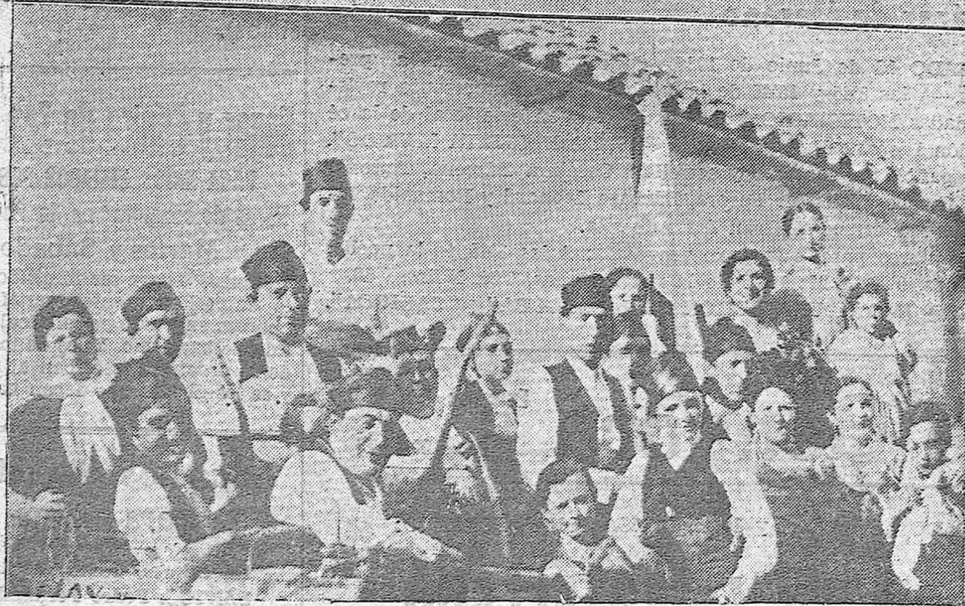
Arriba: Nuevos bachilleres del Instituto Nacional de Segunda Enseñanza que se reunieron en fraternal banquete.—Abajo: La notable Rondalla aragonesa que dió varios conciertos en diversos lugares de la capital con motivo de su actuación en el Teatro Duque de Rivas.